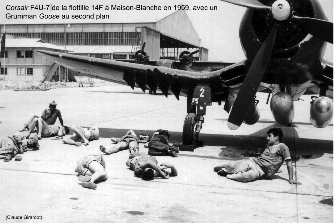
Corsair F4U-7 de la flottille 14F à Maison-Blanche en 1959, avec un Grumman Goose au second plan