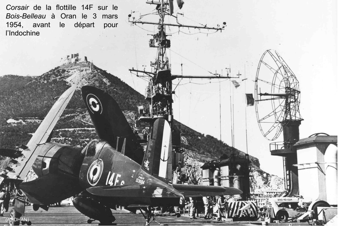
Corsair de la flottille 14F sur le Bois-Belleau à Oran le 3 mars 1954, avant le départ pour l'Indochine