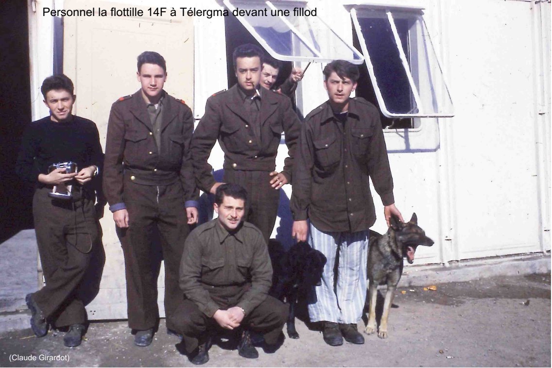
Personnel la flottille 14F à Télérgma devant une fillod