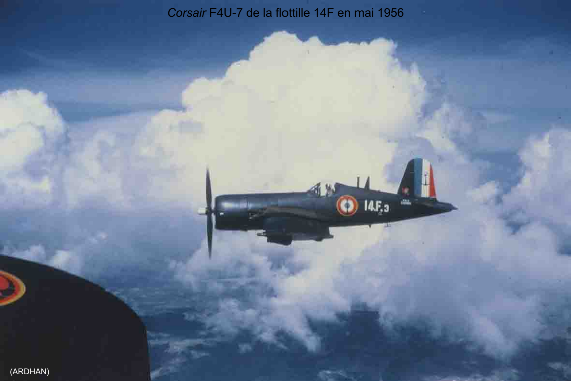
Corsair F4U-7 de la flottille 14F en mai 1956