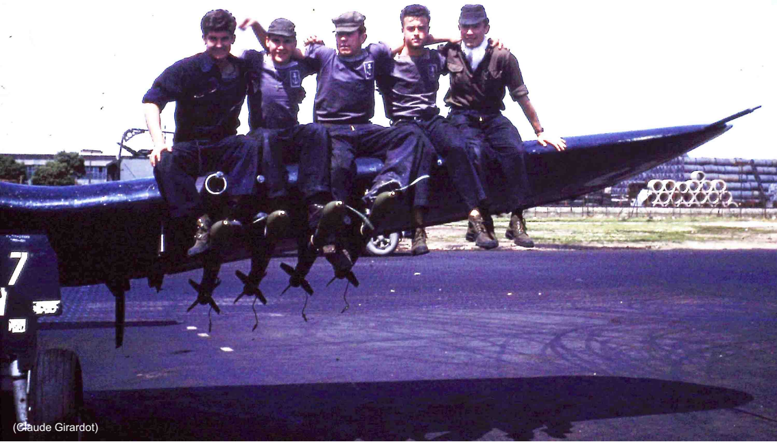
Personnel de la flottille 14F à Téliergma