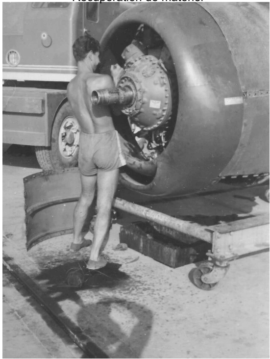
Récupération de matériel