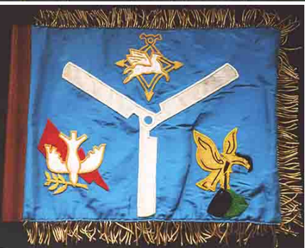
L'étendard du GHAN 1 rassemble les insignes des trois flottilles d'hélicoptères