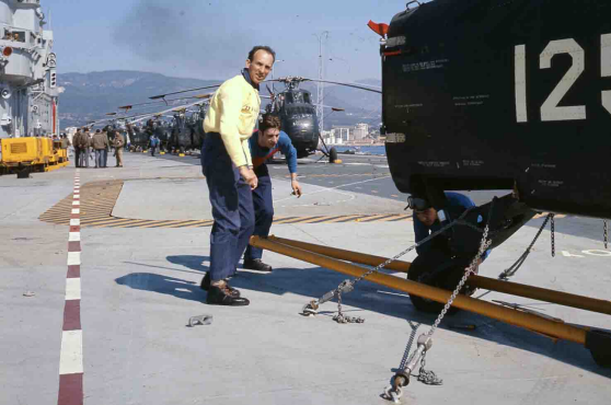
Sur l'Arromanches, en rade de Toulon