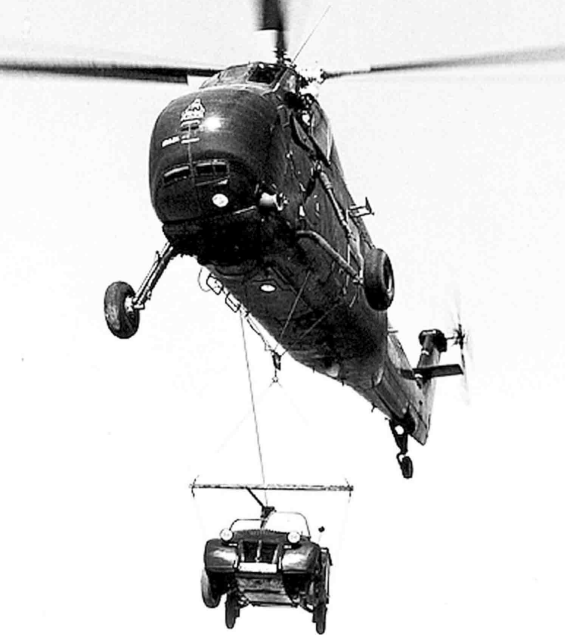
La 2 cv Jules hélipotée par un HSS-1