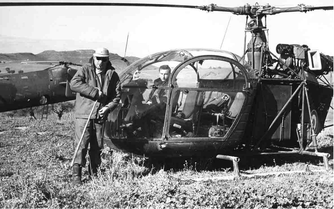
GHAN 1 – Le CC Babot et une Alouette de l'armée de l'Air