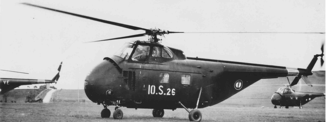
Région de Souk-Ahras, janvier 1956 – Le premier H-19 de la Marine en Algérie