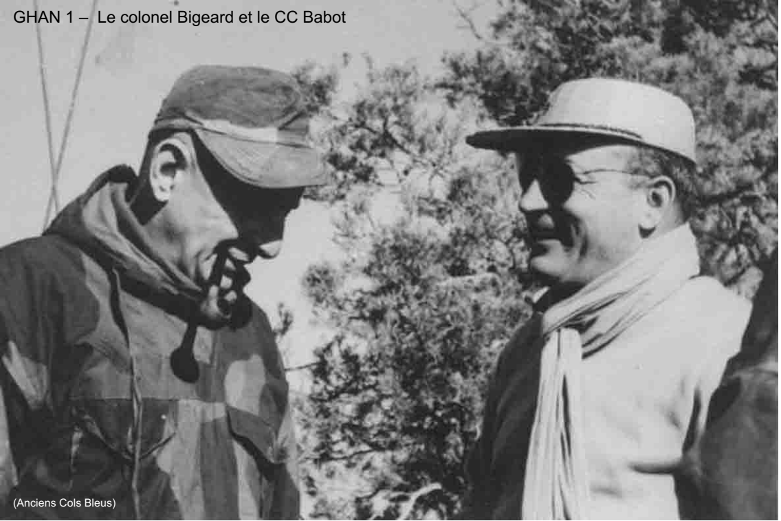
(Anciens Cols Bleus)