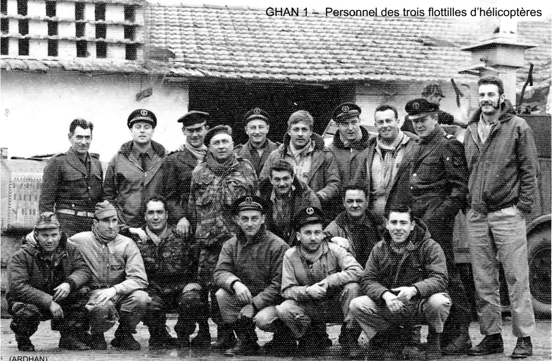
GHAN 1 – Personnel des trois flottilles d'hélicoptères