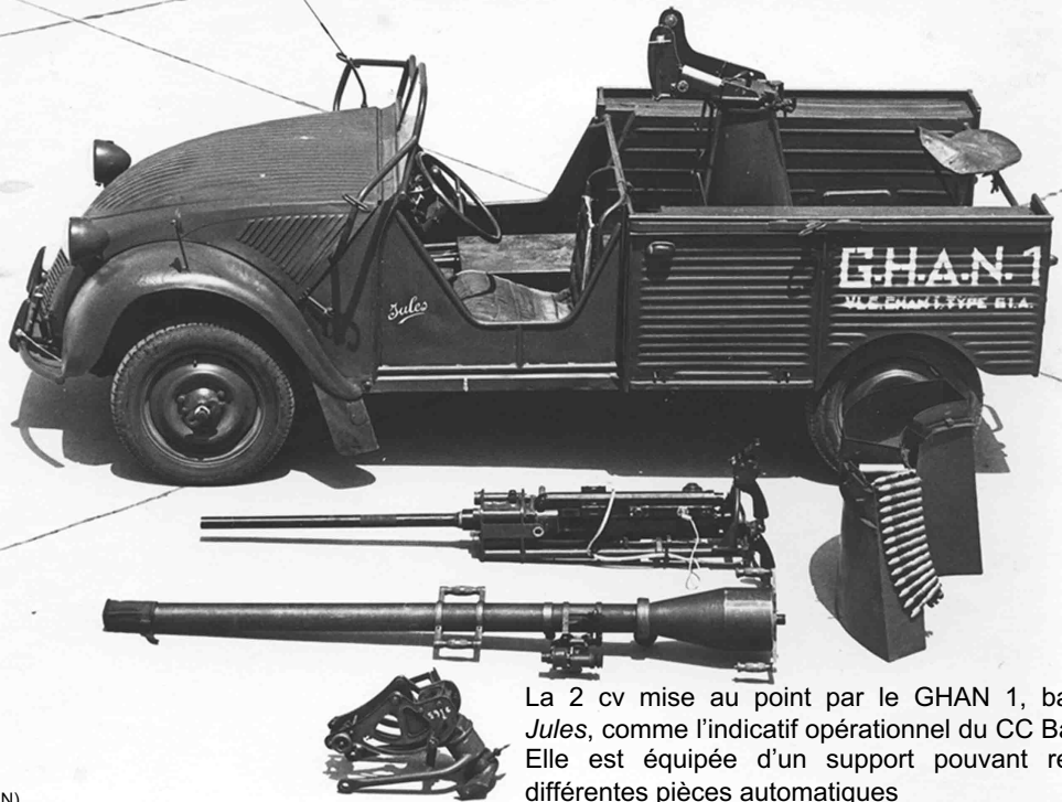
La 2 cv mise au point par le GHAN 1, baptisée Jules , comme l'indicatif opérationnel du CC Barbot – Elle est équipée d'un support pouvant recevoir différentes pièces automatiques