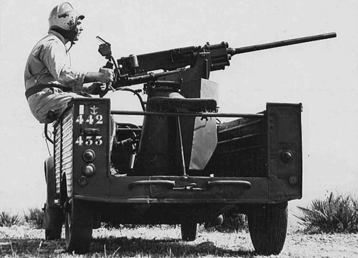
Mise au point de la 2 cv Jules