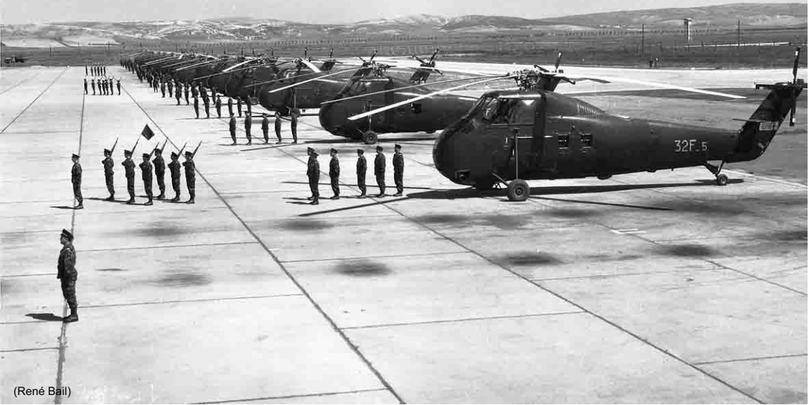
Le GHAN à Lartigue – Le CC Babet est au premier plan, puis les trois gardes d'honneur de chaque flottille