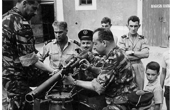
Mise au point de la 2 cv Jules