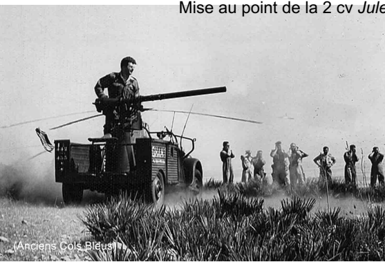
(Anciens Cols Bleus)