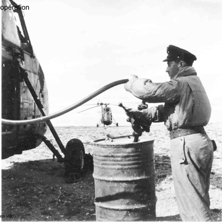
Le GHAN 1 en opération