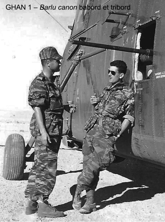
GHAN 1 – Barlu canon babord et tribord