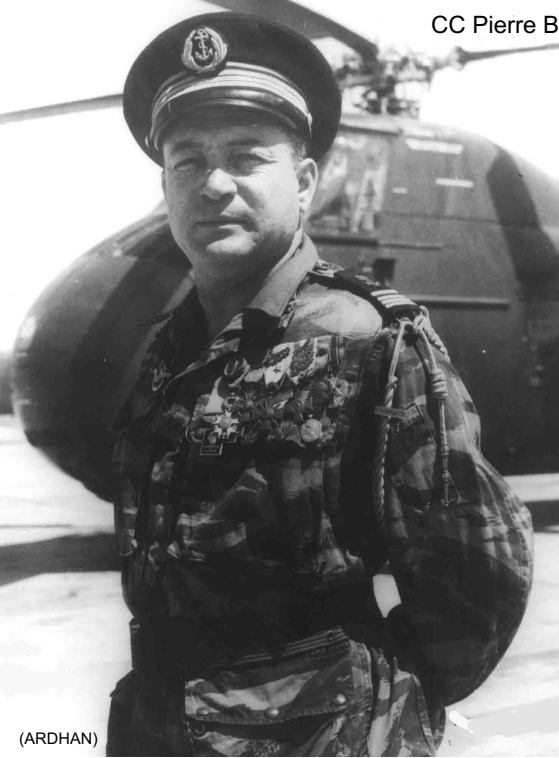
CC Pierre Babot