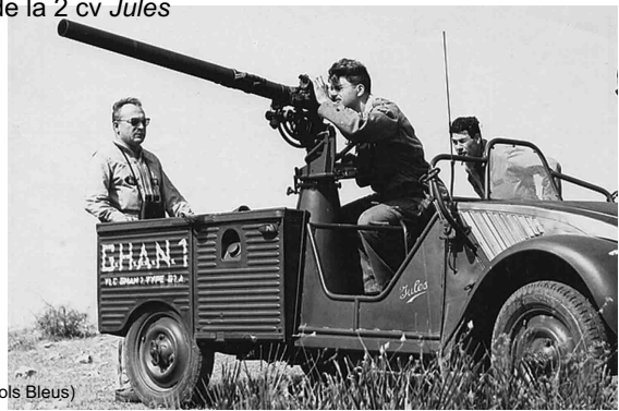
(Anciens Cols Bleus)