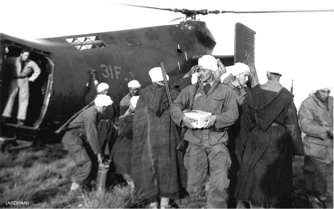
Flottille 31F – El-Aricha – Ravitaillement d'une harka