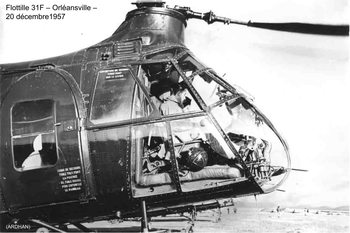
Flottille 31F – Orléansville – 20 décembre 1957