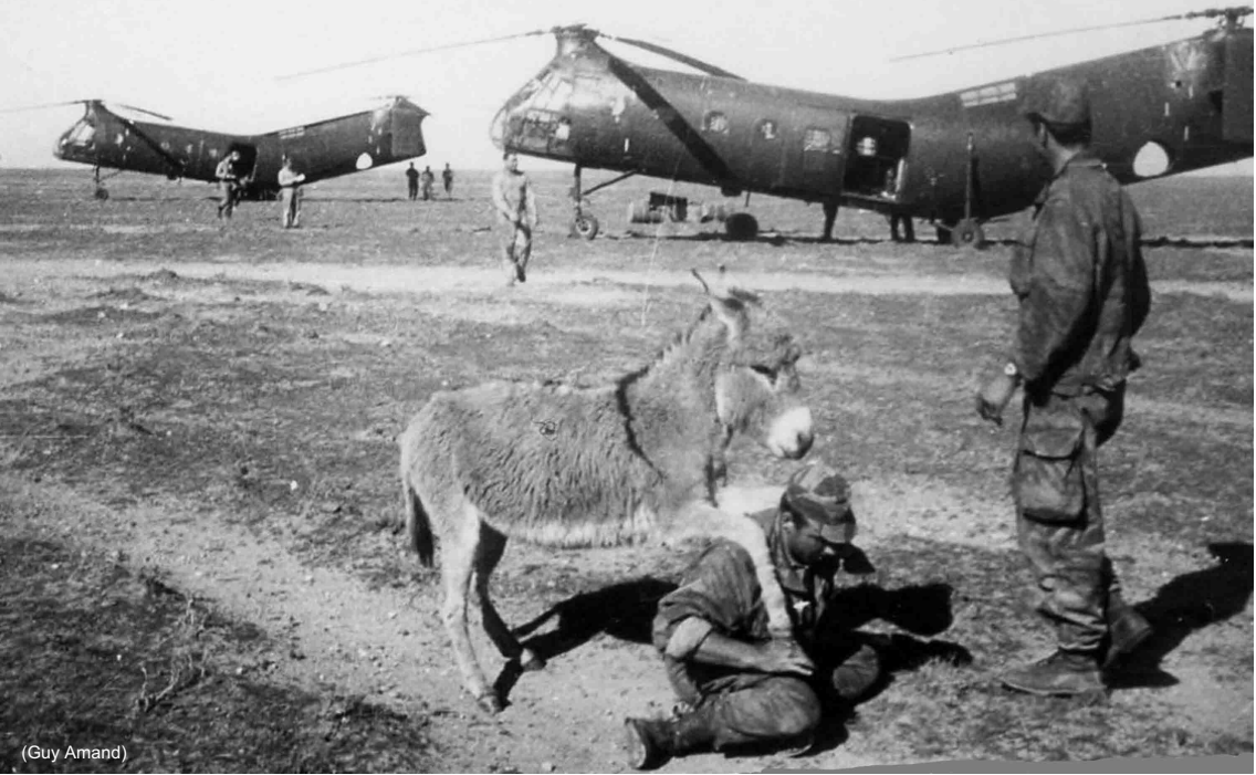
Flottille 31F – Janvier 1959 – A La-Fontaine (dpt Tiaret), avec le Commando de l'Air 10/541