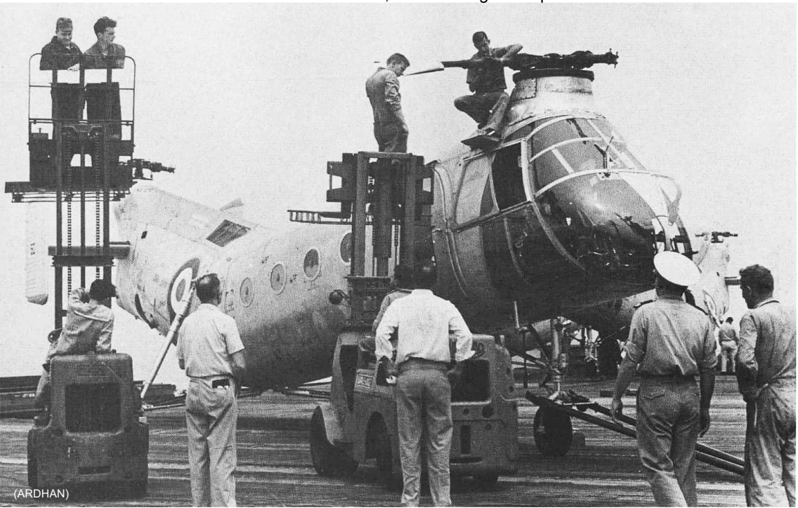
Flottille 31F – Juin 1956 – Sur le Dixmude , arrivée à Alger des premiers H-21 de l'ALAT