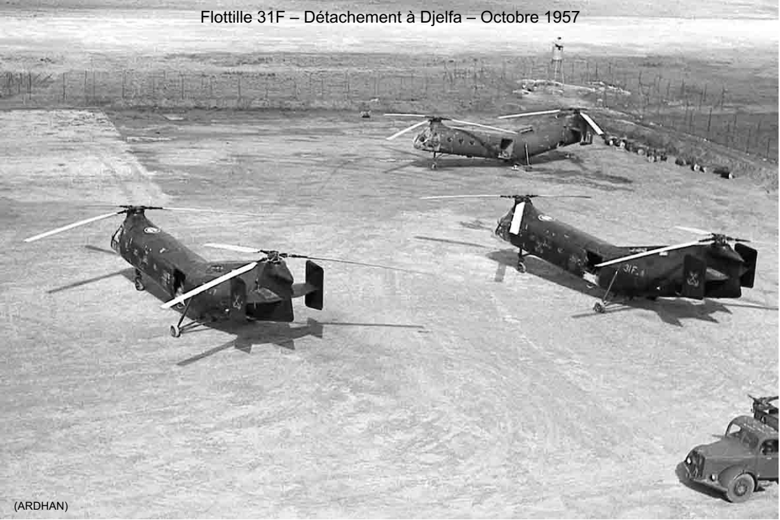
Flottille 31F – Détachement à Djelfa – Octobre 1957