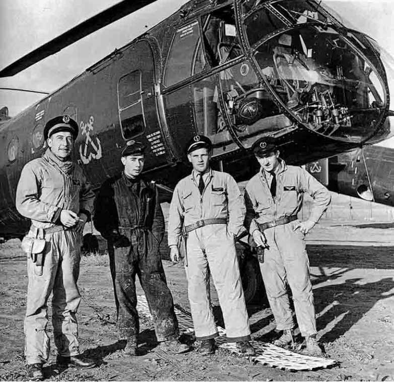
Flottille 31F 31 décembre 1957 Equipage du LV Beau