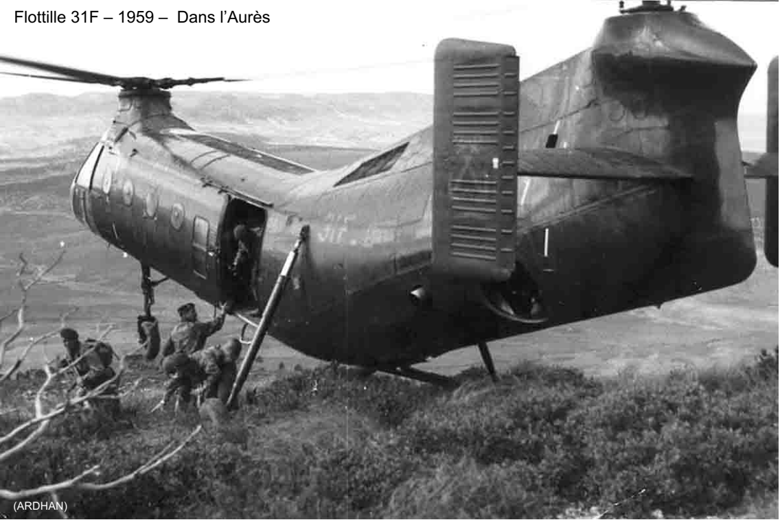
Flottille 31F – 1959 – Dans l'Aurès