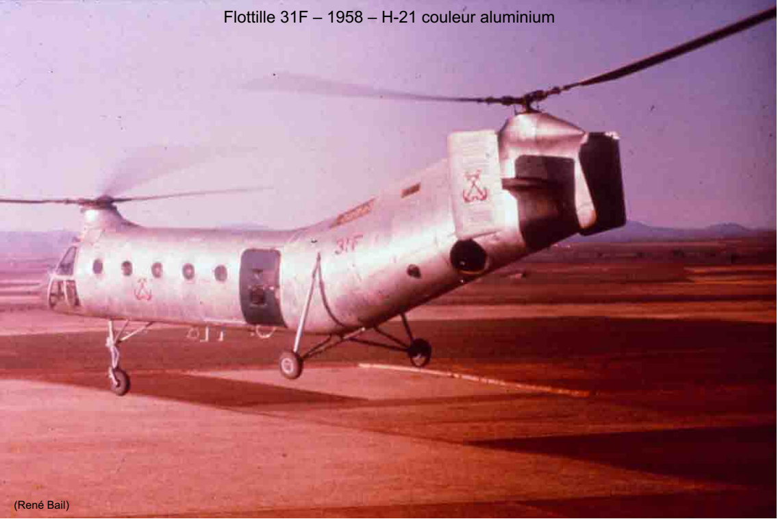
Flottille 31F – 1958 – H-21 couleur aluminium