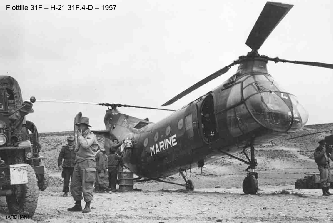
Flottille 31F – H-21 31F.4-D – 1957