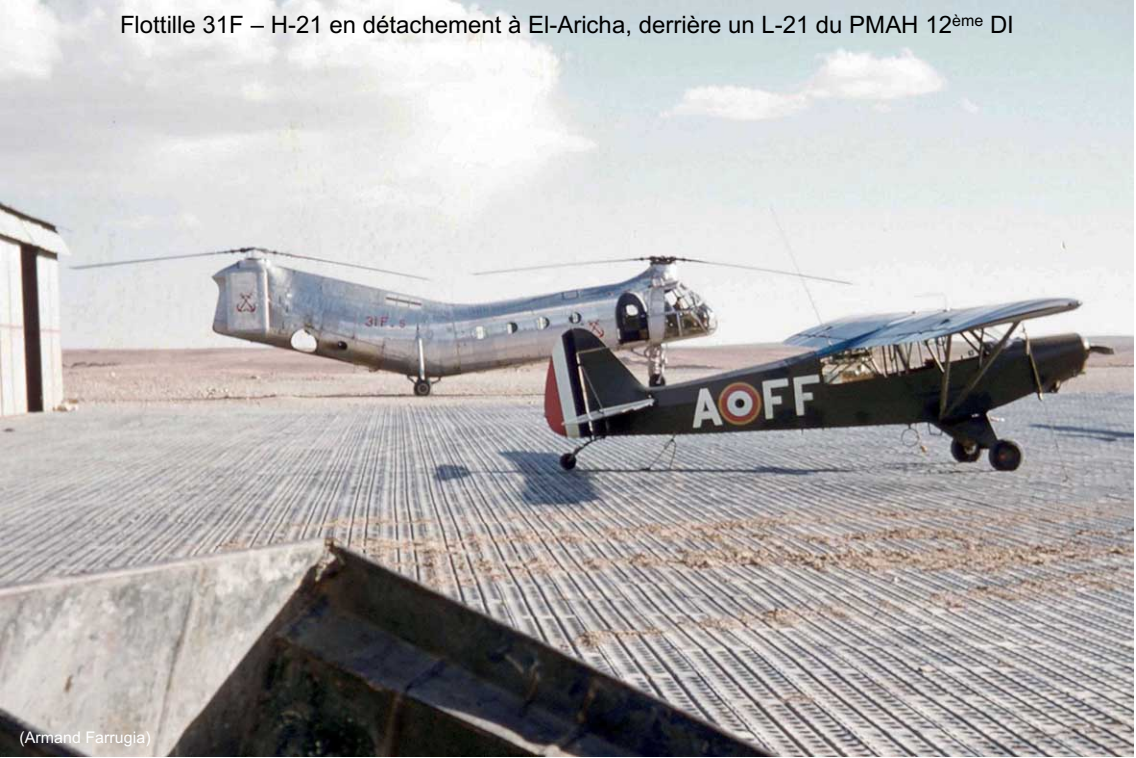
Flottille 31F – H-21 en détachement à El-Aricha, derrière un L-21 du PMAH 12 ème DI