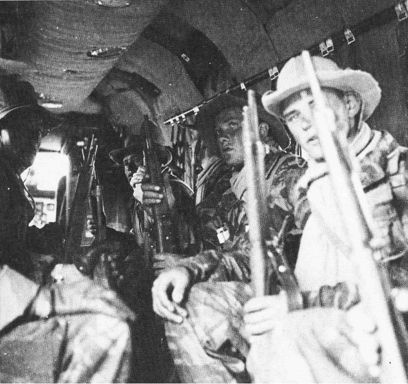
Flottille 31F Légionnaires du 1 er REP