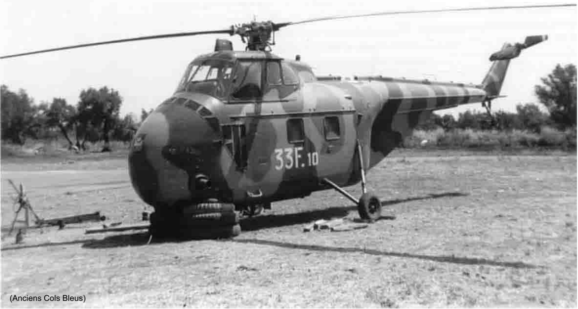
(Anciens Cols Bleus)