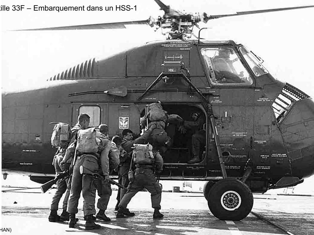
Flottille 33F – Embarquement dans un HSS-1