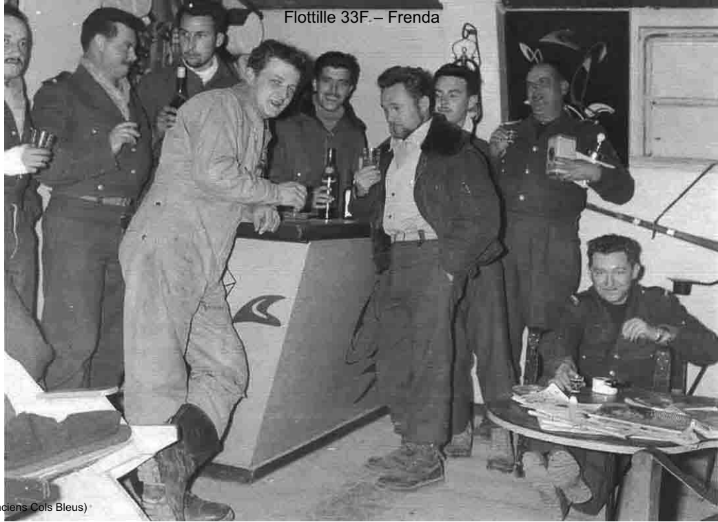
(Anciens Cols Bleus)