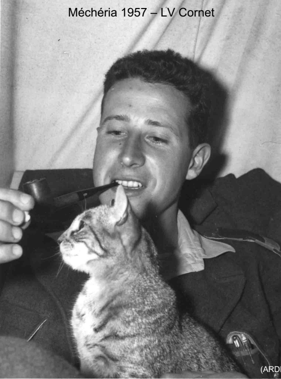
Méchéria 1957 – LV Cornet