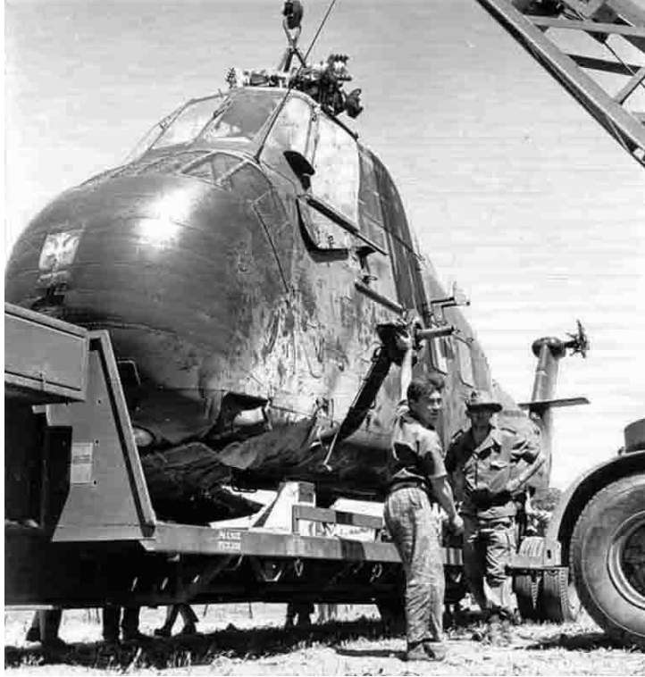
Flottille 33F Récupération d'un HSS-1 accidenté