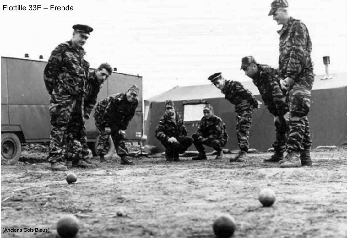
(Anciens Cols Bleus)