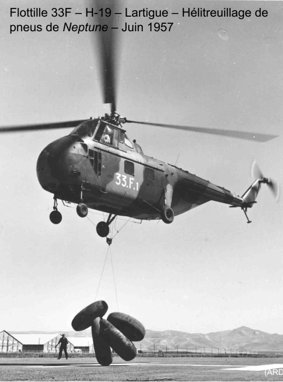
Flottille 33F – H-19 – Lartigue – Hélicoptère de pneus de Neptune – Juin 1957