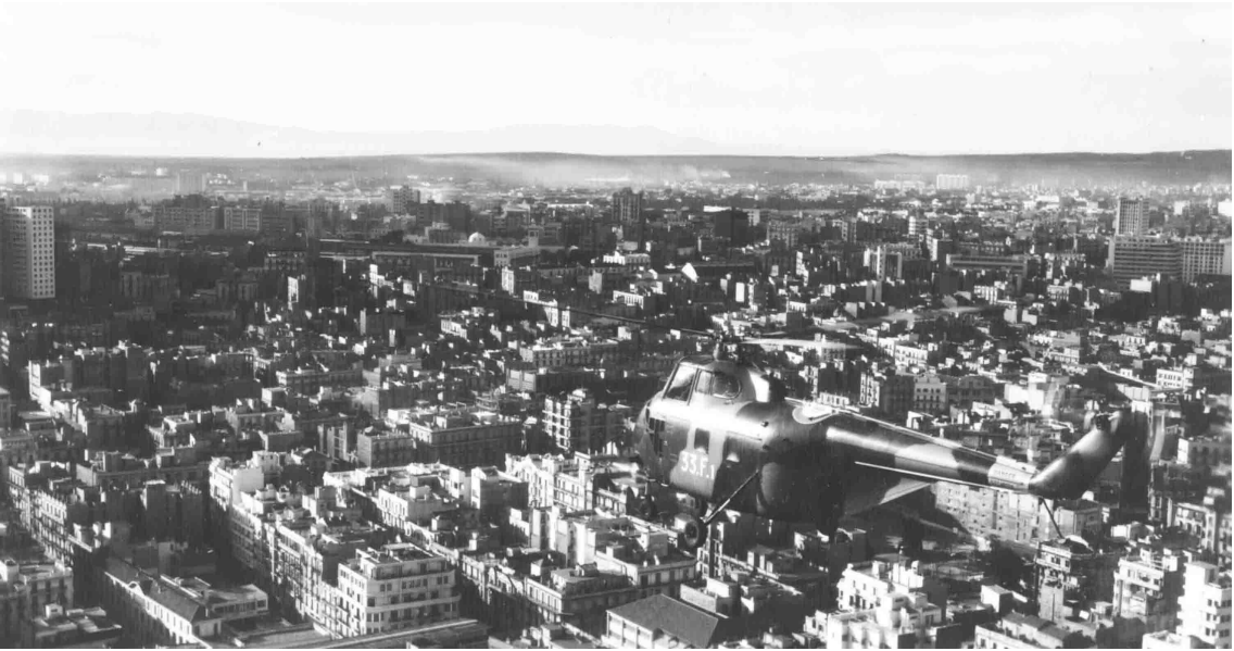
Flottille 33F – H-19 sur Oran, le 11 novembre 1957