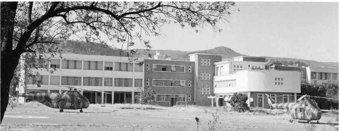
Flottille 33F – L'hôpital d'évacuation de Tlemcen et deux H-19 en attente d'intervention sur la DZ, devant le bloc opératoire