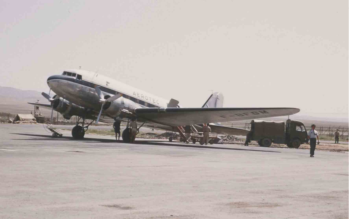
— DC-3 à Tébessa en juin 1959 (Jean-Louis Gosseume)