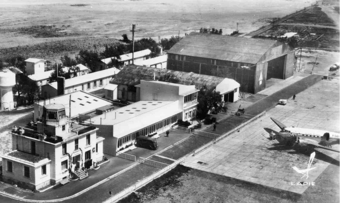
DC-3 F-OABV d' Air Atlas à Perpignan-La Llbanère vers 1950