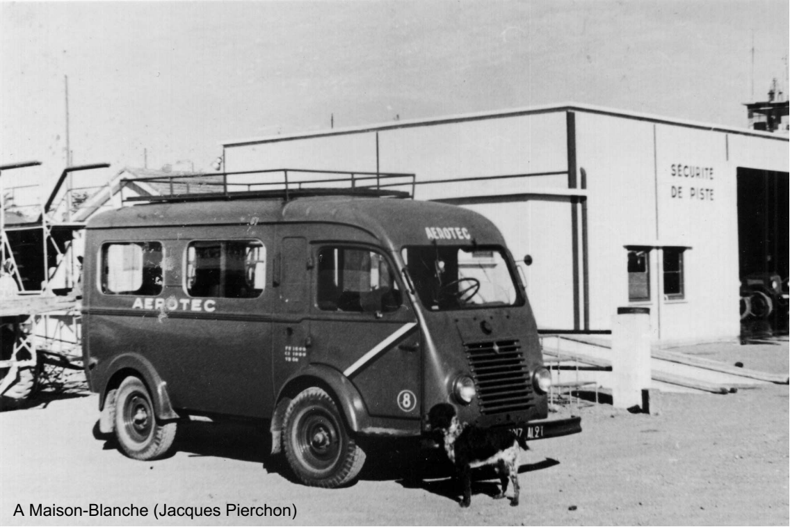
A Maison-Blanche (Jacques Pierchon)