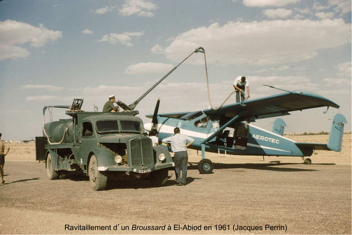
Ravitaillement d'un Broussard à El-Abiod en 1961 (Jacques Perrin)