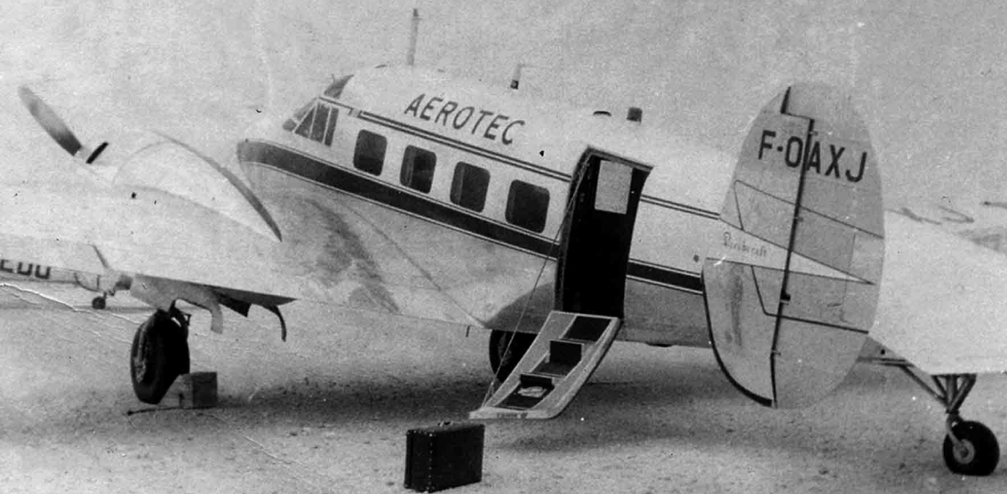
Beechcraft 18 (Sylvain Riva)