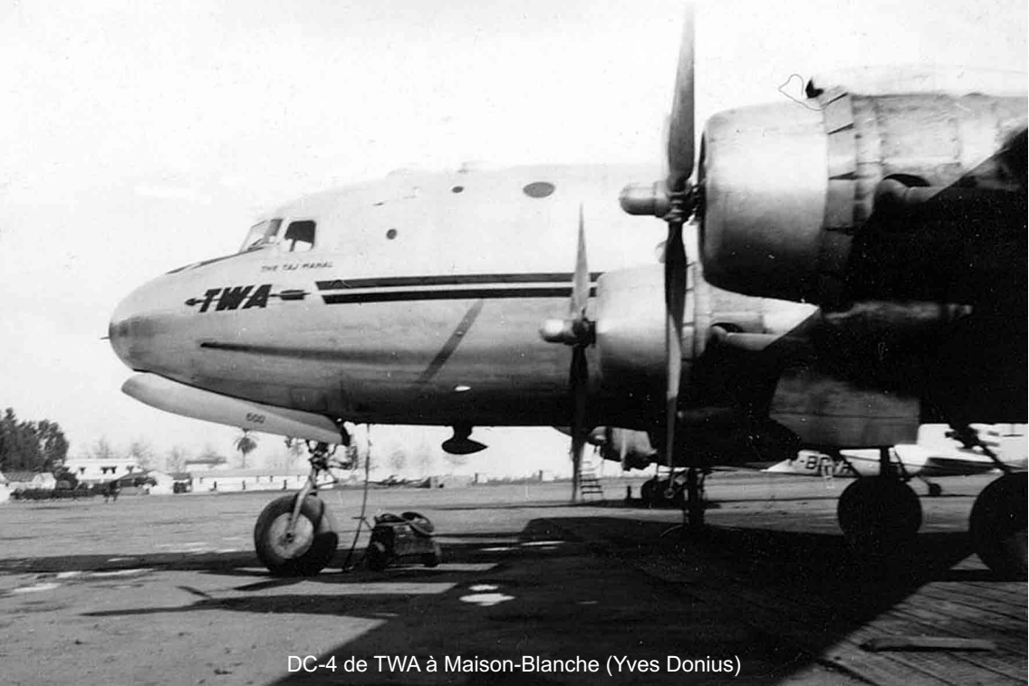
DC-4 de TWA à Maison-Blanche (Yves Donius)