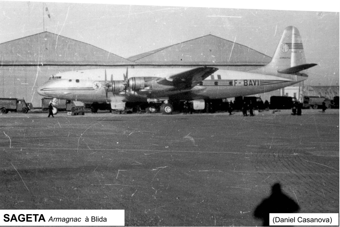
SAGETA Armagnac à Blida