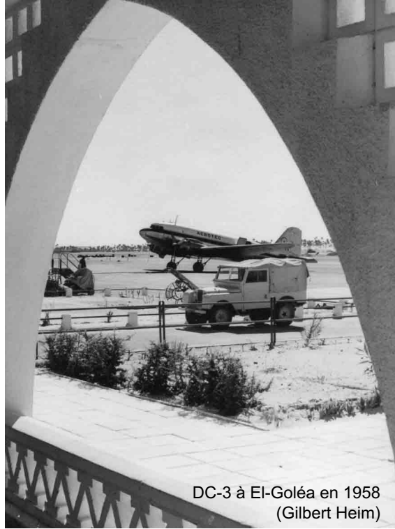
DC-3 à El-Goléa en 1958 (Gilbert Heim)