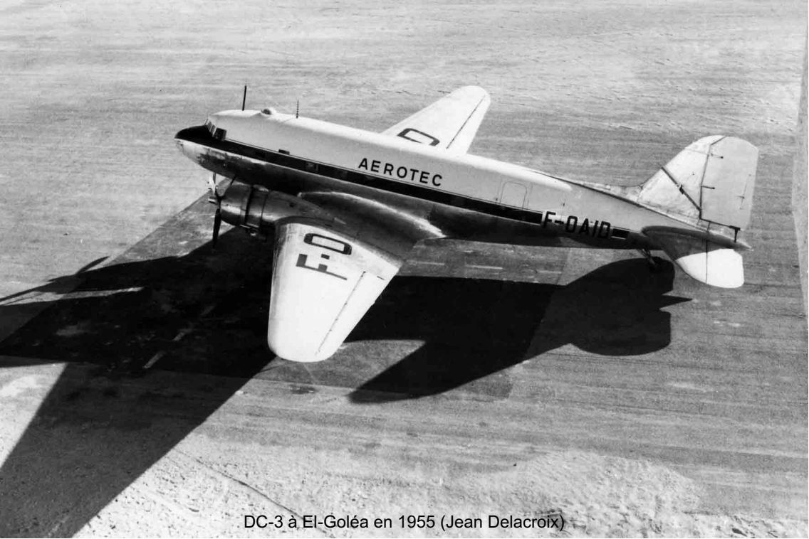
DC-3 à El-Goléa en 1955 (Jean Delacroix)