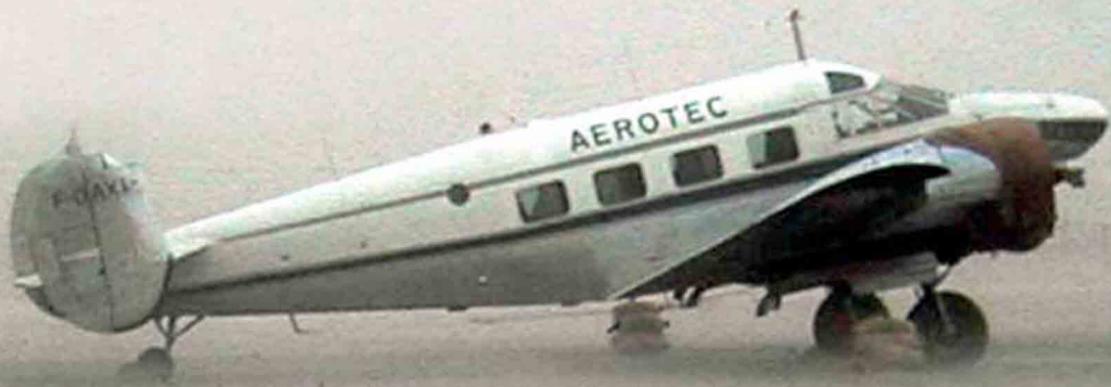
Beechcraft 18 dans le vent de sable (Alain Crosnier)