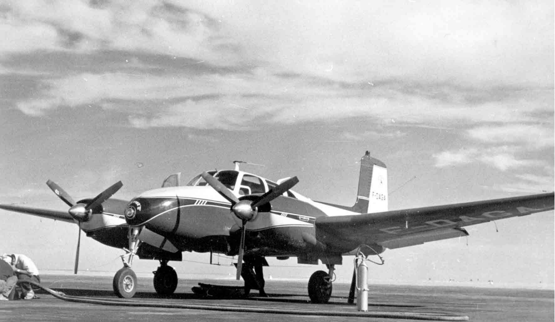
A Adrar en 1961, le Beechcraft Twin-Bonanza de la Société Norafor en route pour Edjelé (Jean Delacroix)