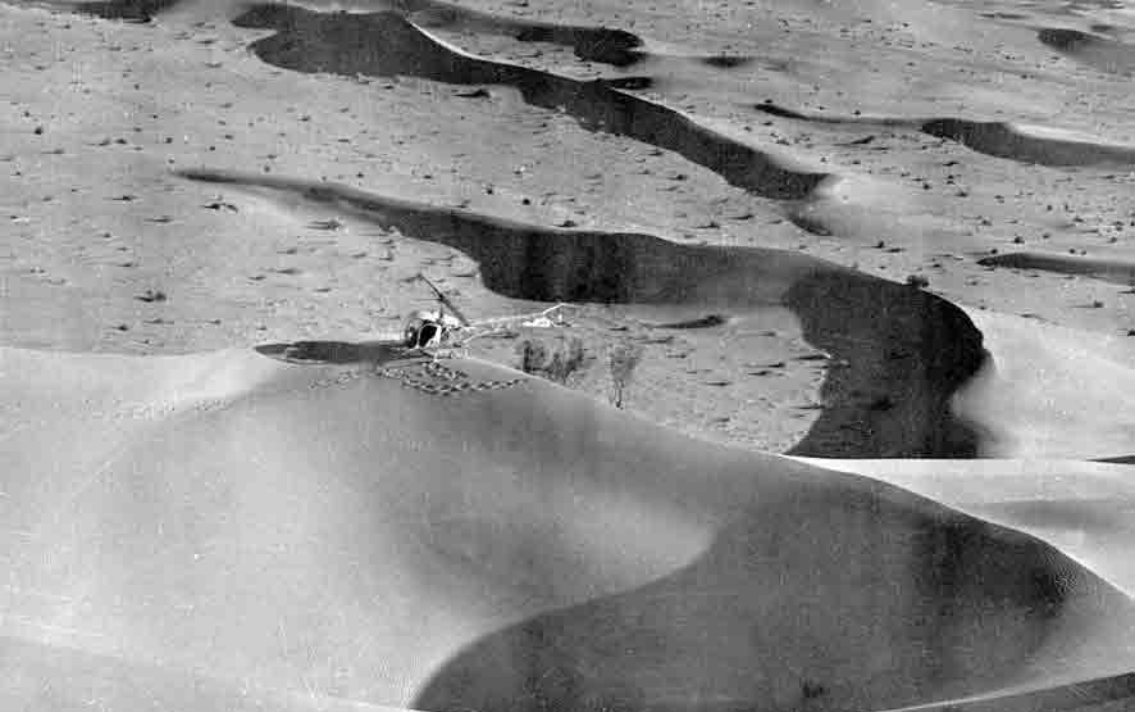
Bell 47 G2 dans le Grand Erg Oriental en 1960 (André Morel)