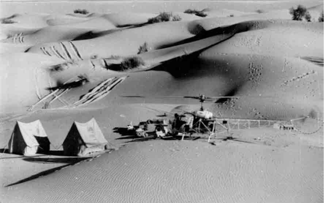
Ravitaillement d'une équipe de pétroliers topographes (André Morel)