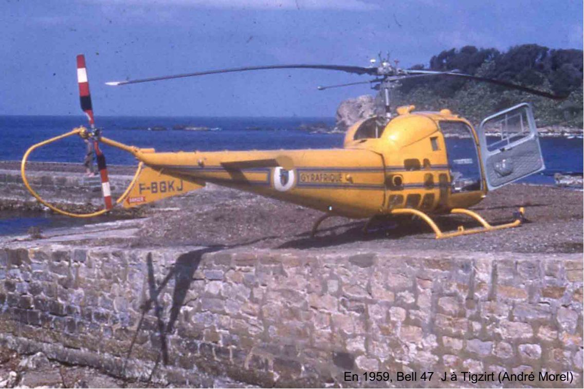
En 1959, Bell 47 J à Tizirt (André Morel)