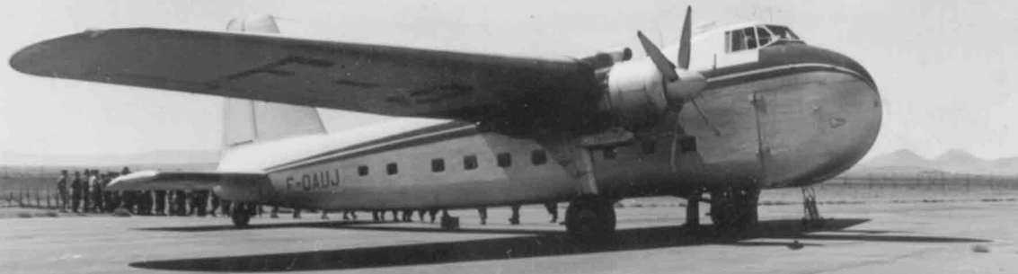
En 1956 à Oujda, le Bristol Freighter de Gyrafrique utilisé pour transporter les hélicoptères et les pièces (André Calay)