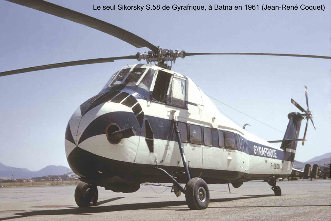
Le seul Sikorsky S.58 de Gyrafrique, à Batna en 1961