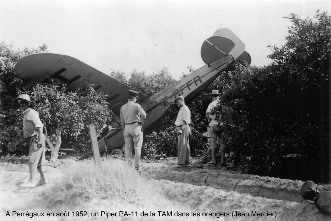
A Perrégaux en août 1952, un Piper PA-11 de la TAM dans les orangers (Jean Mercier)