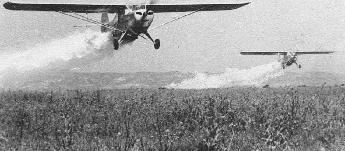
Auster de la SNATA dans la région de Bône, sur du coton (Roland Richer de Forges)