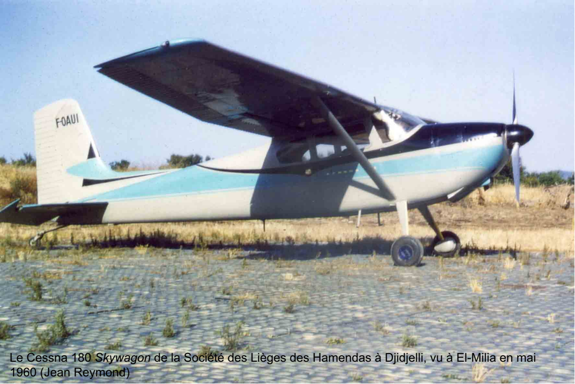
Le Cessna 180 Skywagon de la Société des Lièges des Hamendas à Djidjelli, vu à El-Milia en mai 1960 (Jean Reymond)