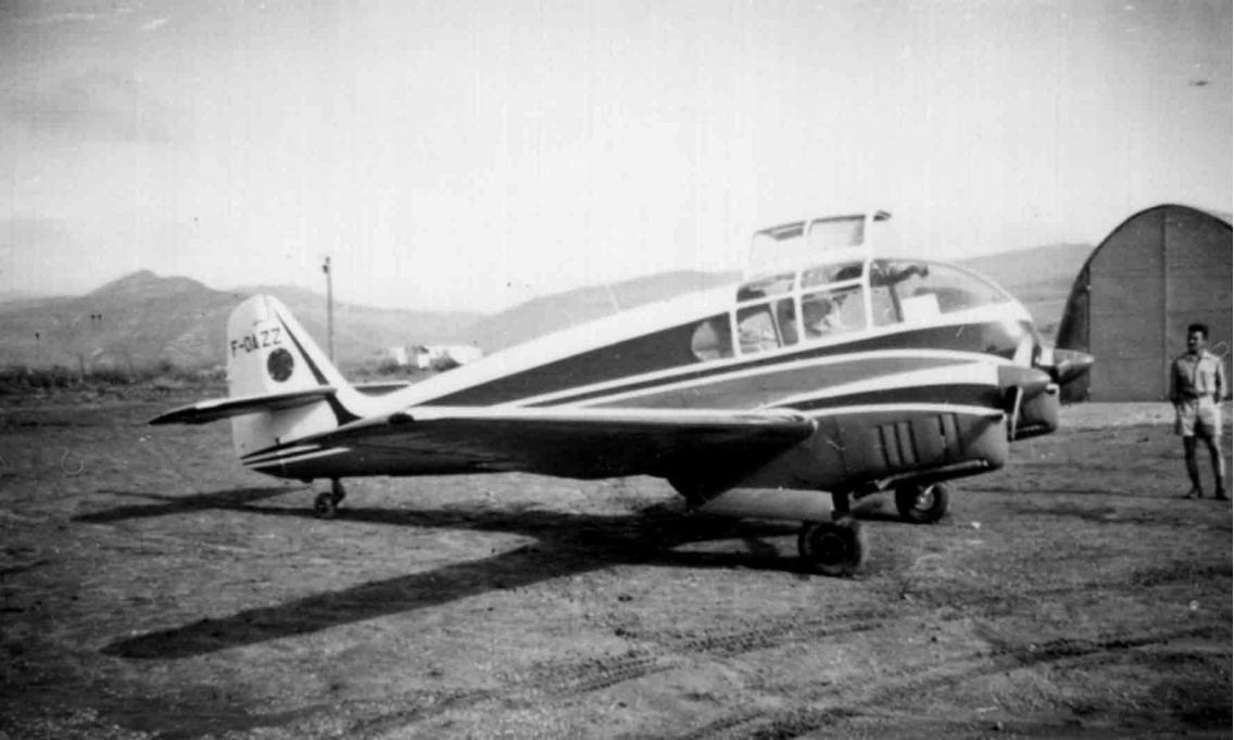
A Souk-Ahras en 1957, le Super Aero 45 de la Compagnie des phosphates du Kouif