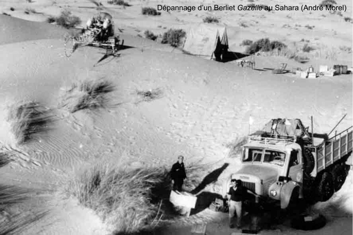
Dépannage d'un Berliet Gazelle au Sahara (André Morel)