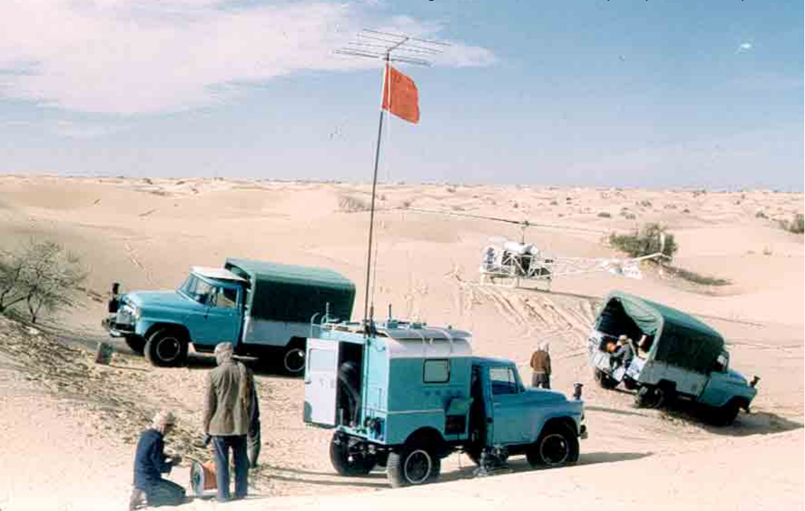
Bell 47 G2 à côté d'un laboratoire itinérant d'enregistrement de tirs sismiques (André Morel)