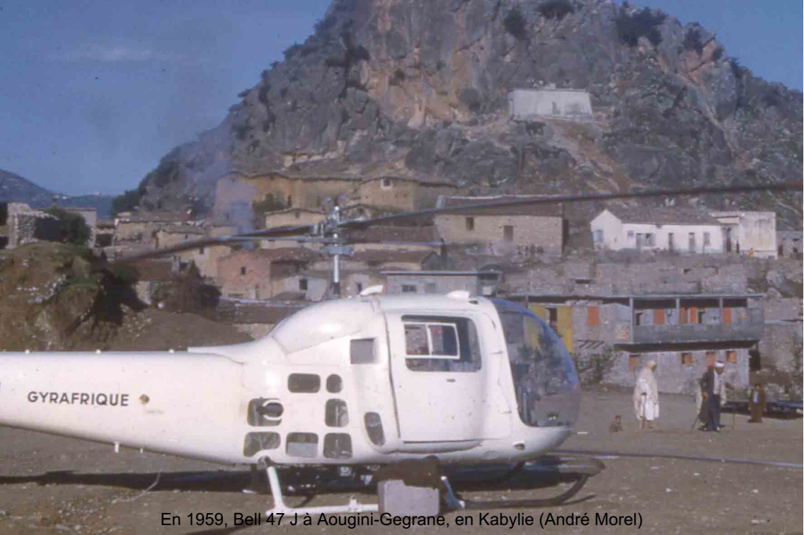
En 1959, Bell 47 J à Aougini-Gegrane, en Kabylie (André Morel)