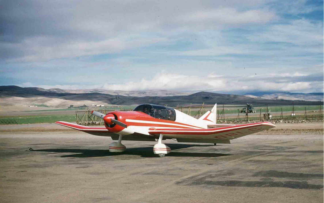
Le Jodel Mousquetaire de la Sté Marchand et Botella à Orléansville en 1959