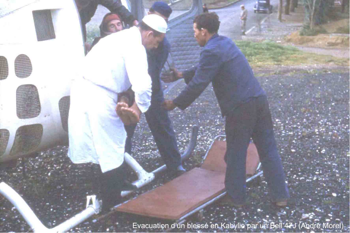
Evacuation d'un blessé en Kabylie par un Bell 47J (André Morel)