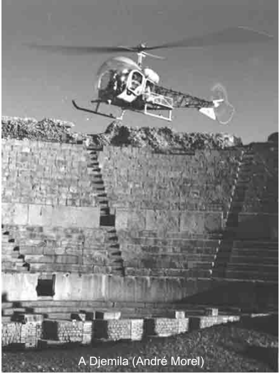
A Djemila (André Morel)