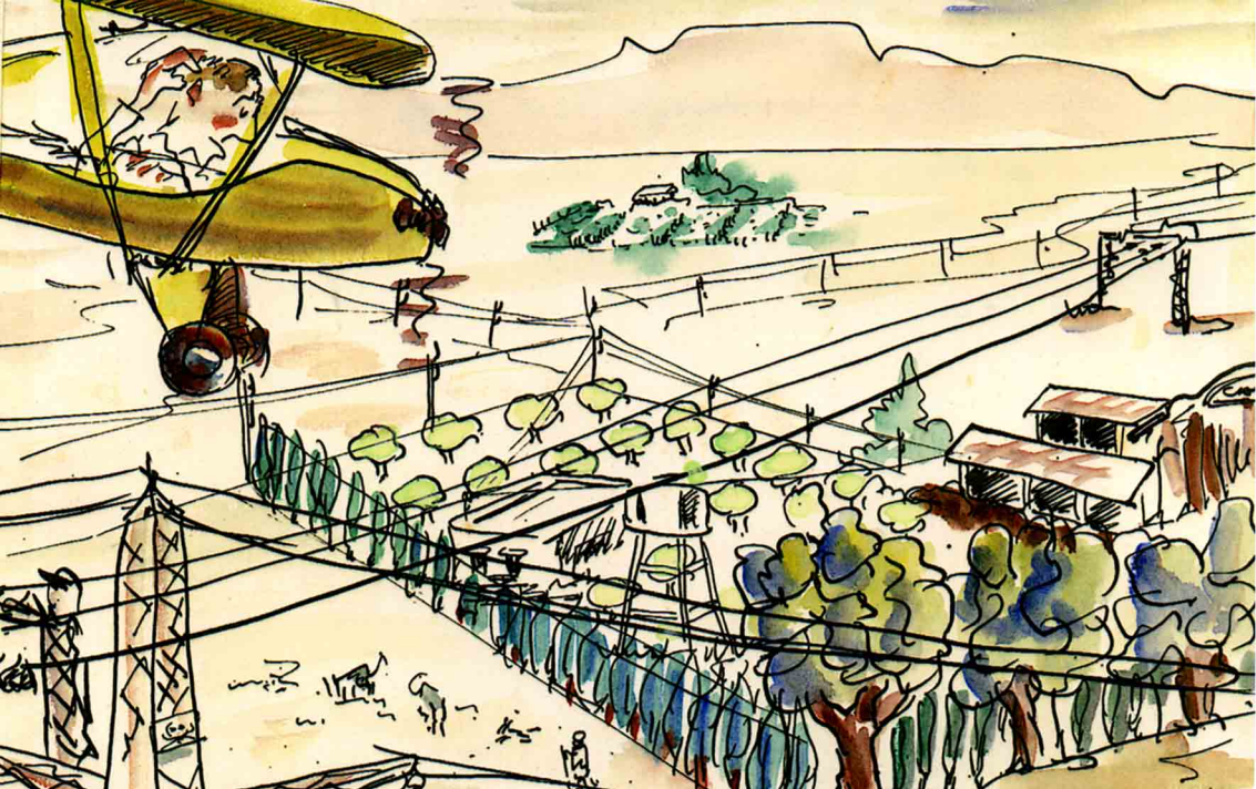
Le travail aérien agricole vu par Henri Gantès, pilote de la TAM