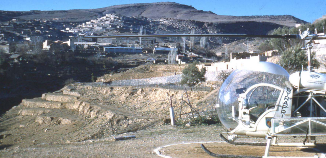
En 1959, Bell 47 G2 à Michelet (André Morel)