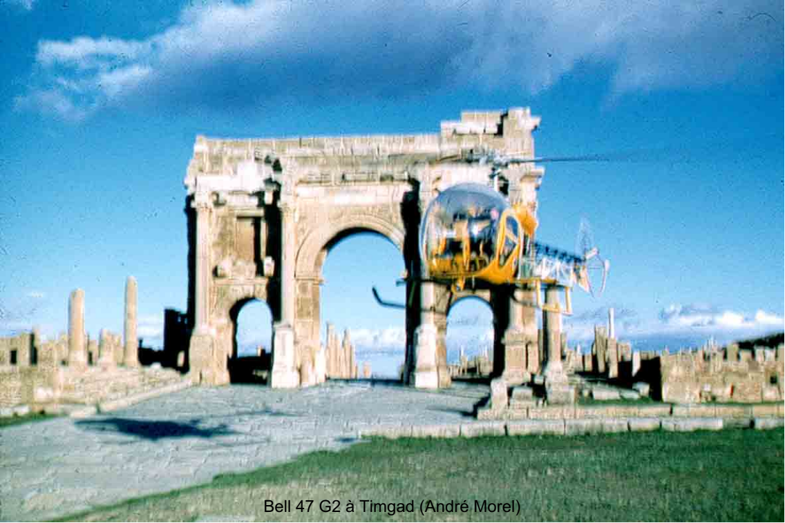
Bell 47 G2 à Timgad (André Morel)