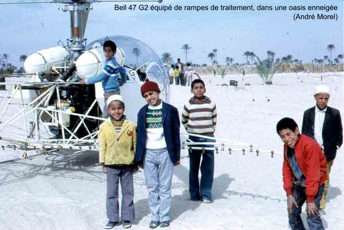
Bell 47 G2 équipé de rampes de traitement, dans une oasis enneigée (André Morel)