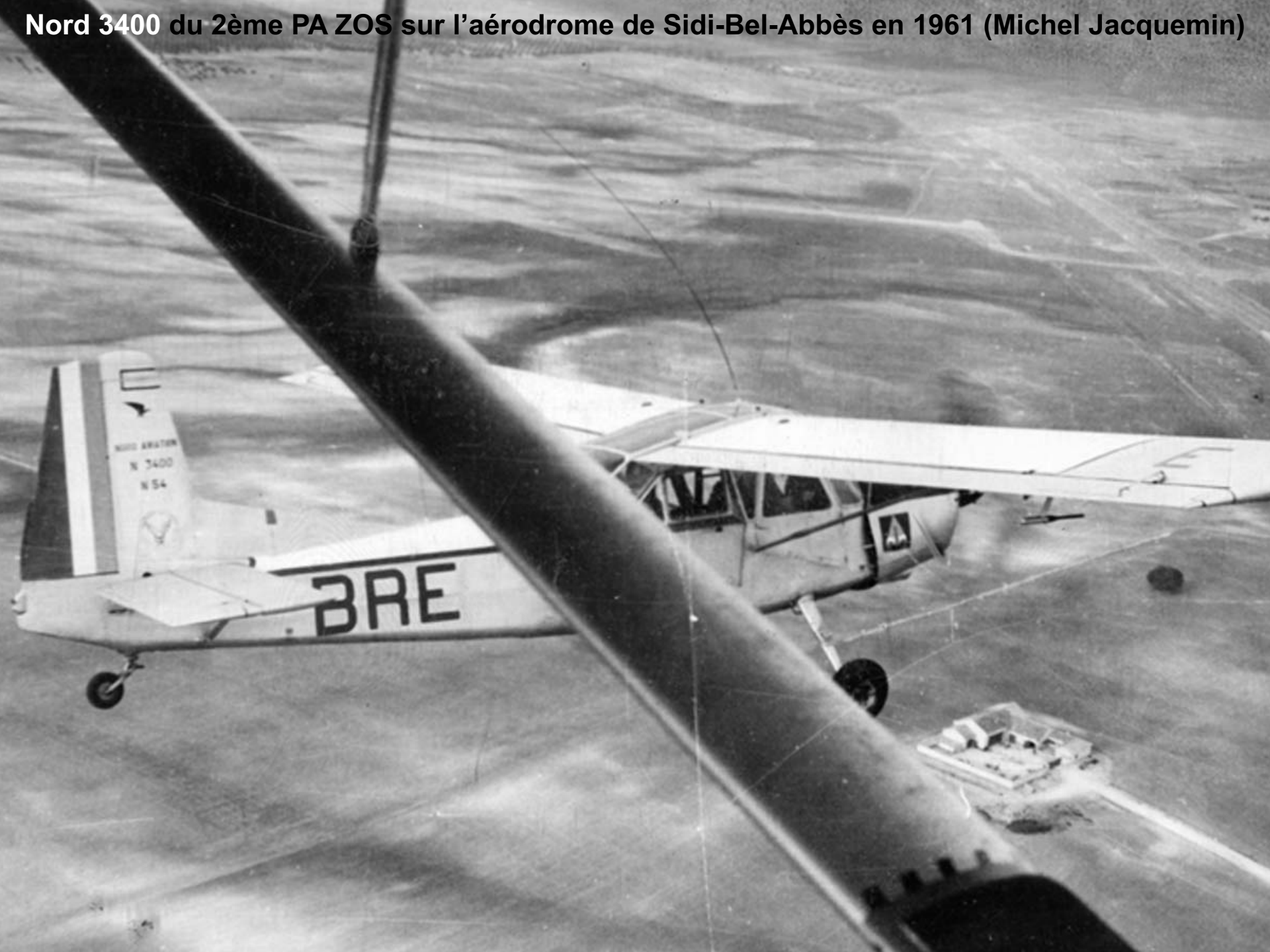
Nord 3400 du 2ème PA ZOS sur l'aérodrome de Sidi-Bel-Abbès en 1961 (Michel Jacquemin)