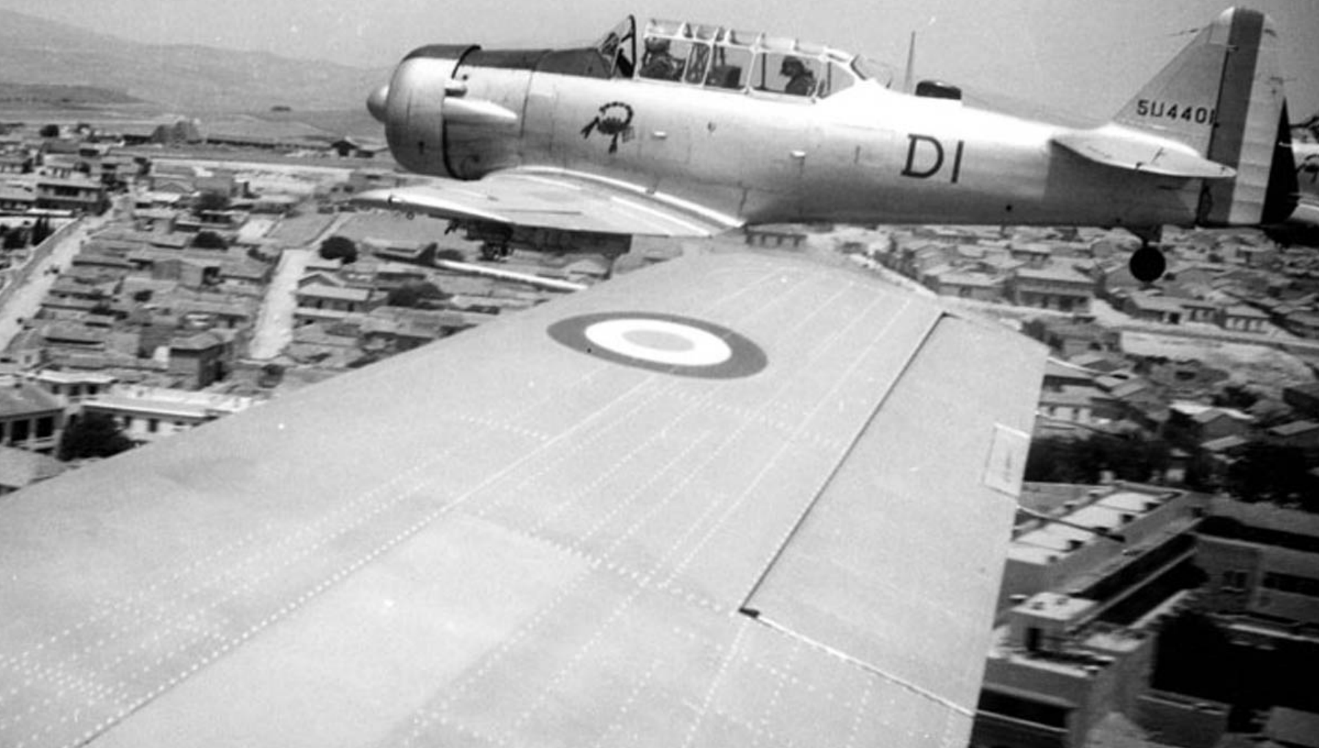
T-6 de l'EALA 19/72 sur Sétif le 14 juillet 1960 (Bernard Chenel)