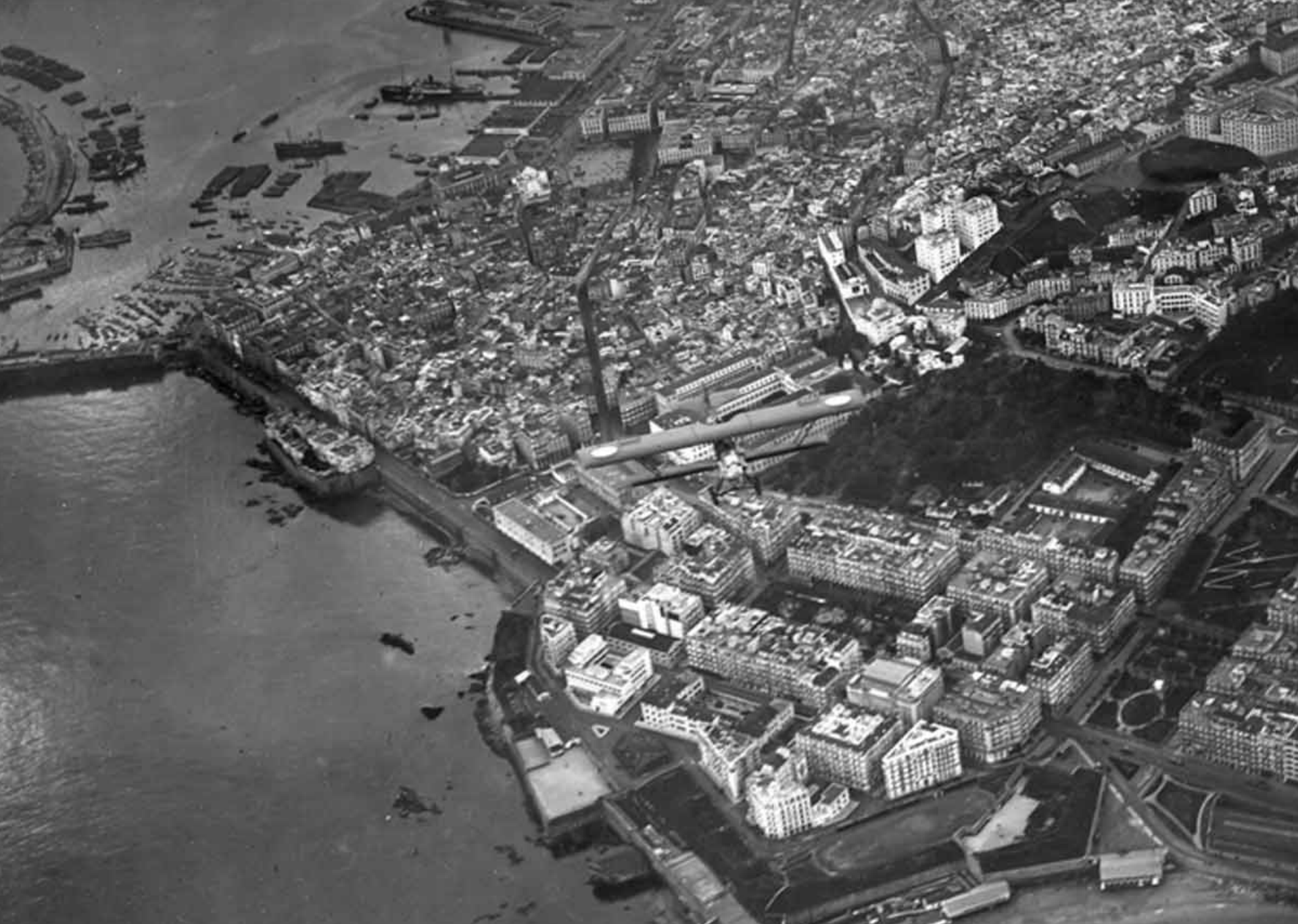
Potez 25 du 1er GAA sur Alger en 1932 (Jean Salvano)