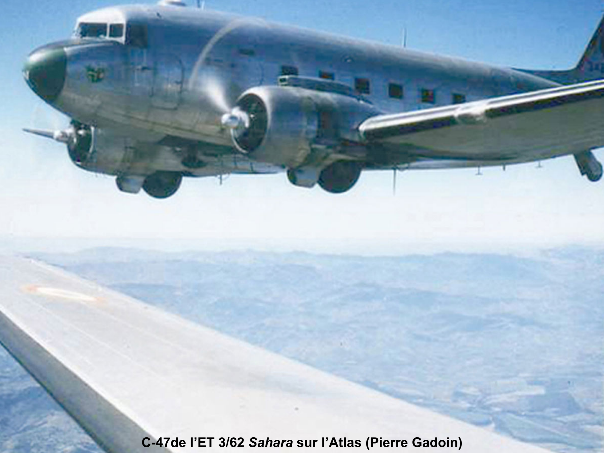
C-47 de l'ET 3/62 Sahara sur l'Atlas (Pierre Gadoin)