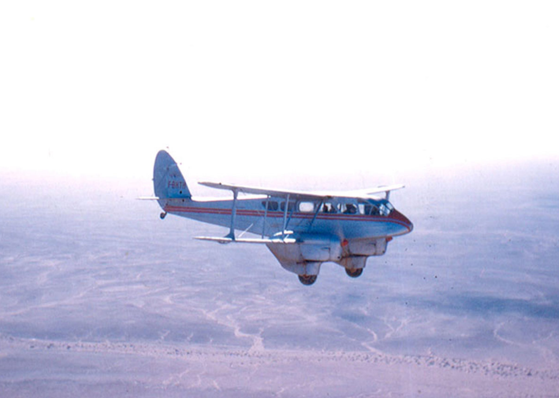
DH 89 Dragon Rapide de la SGAA sur la région de Fort-Flatters en 1958 (Claude Loustau)