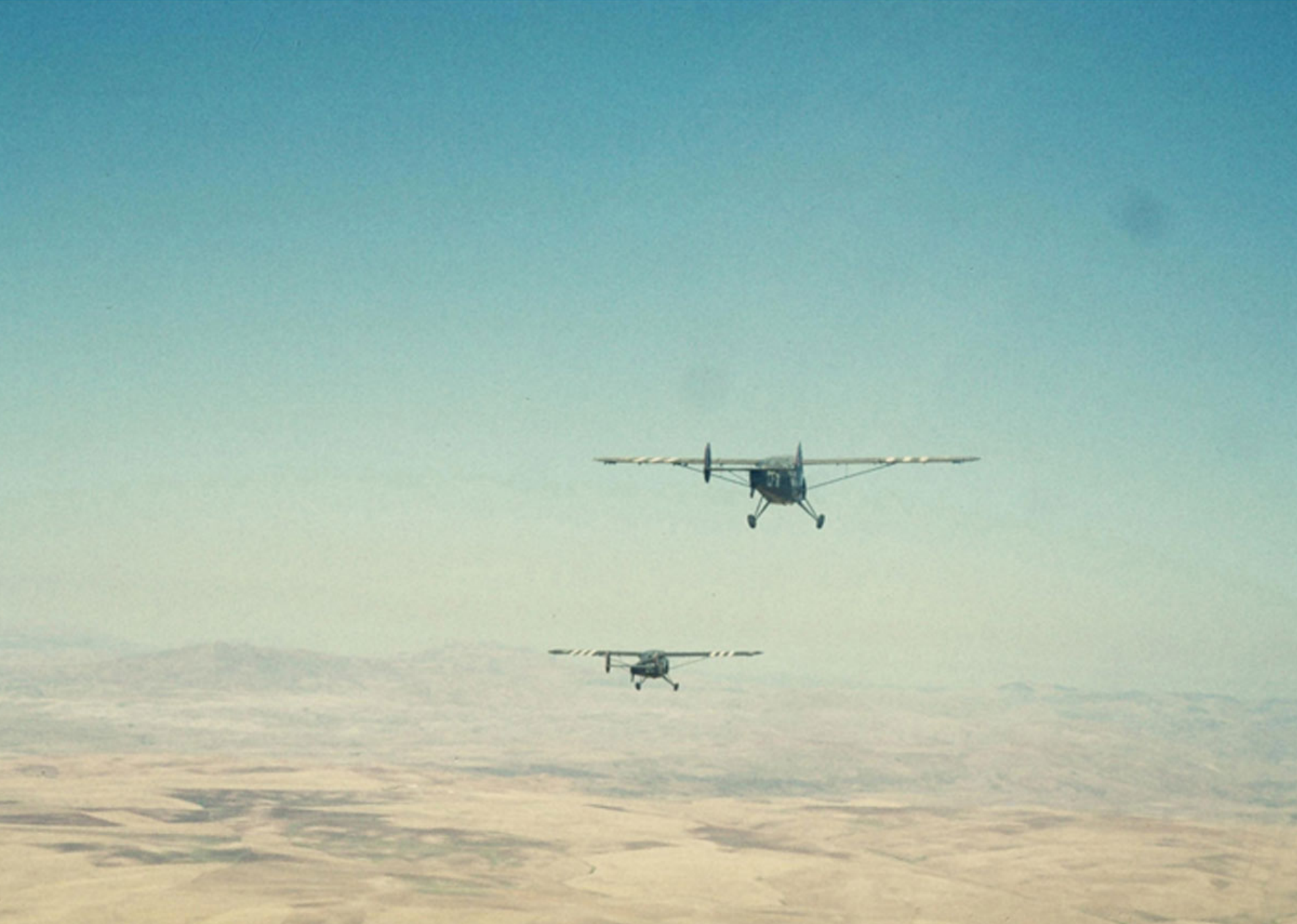
NC 856 du GALAT 3 sur les Hauts-Plateaux en 1958 (francis Fontaine)