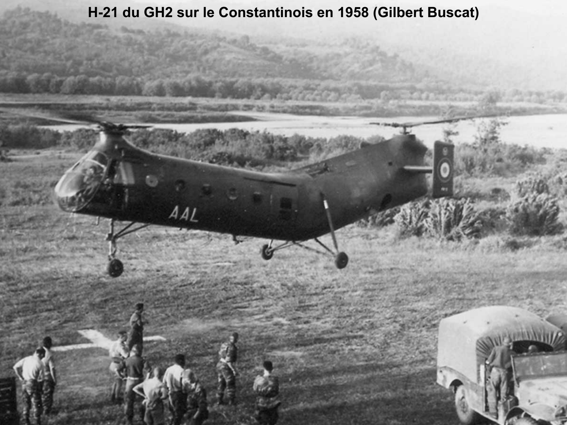
H-21 du GH2 sur le Constantinois en 1958 (Gilbert Buscat)