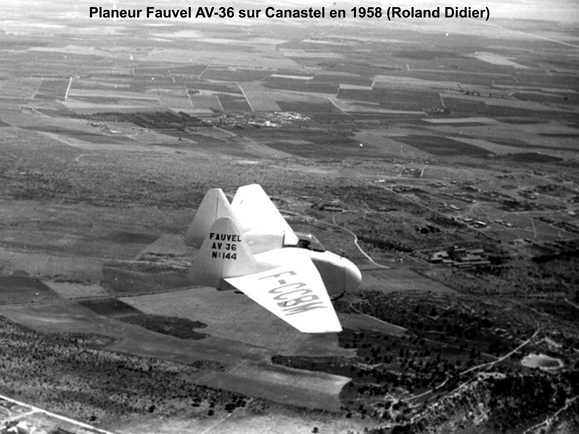
Planeur Fauvel AV-36 sur Canastel en 1958 (Roland Didier)