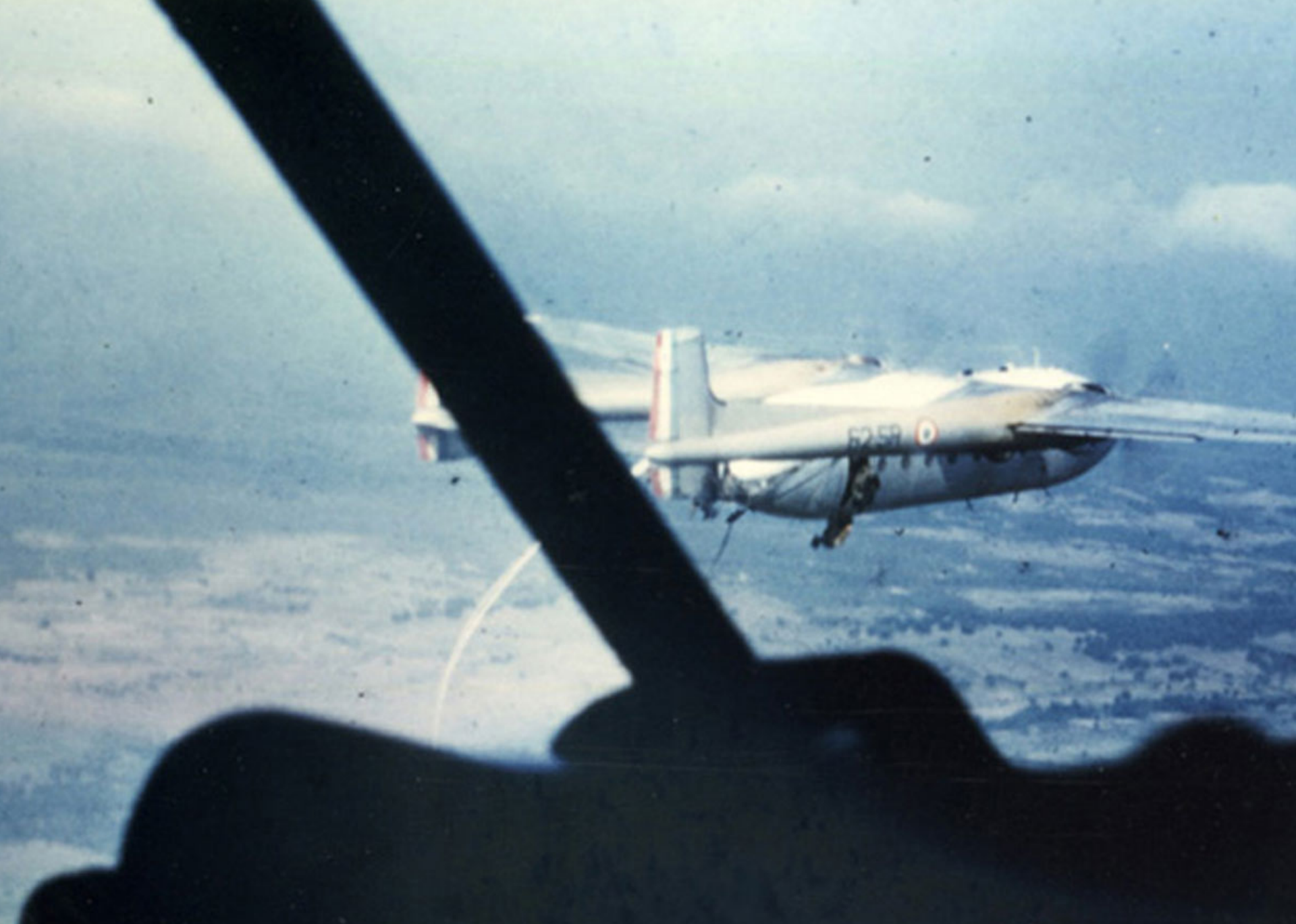
Noratlas de l'ET 62 en largage de parachutistes à Philippeville (Robert Nauze)