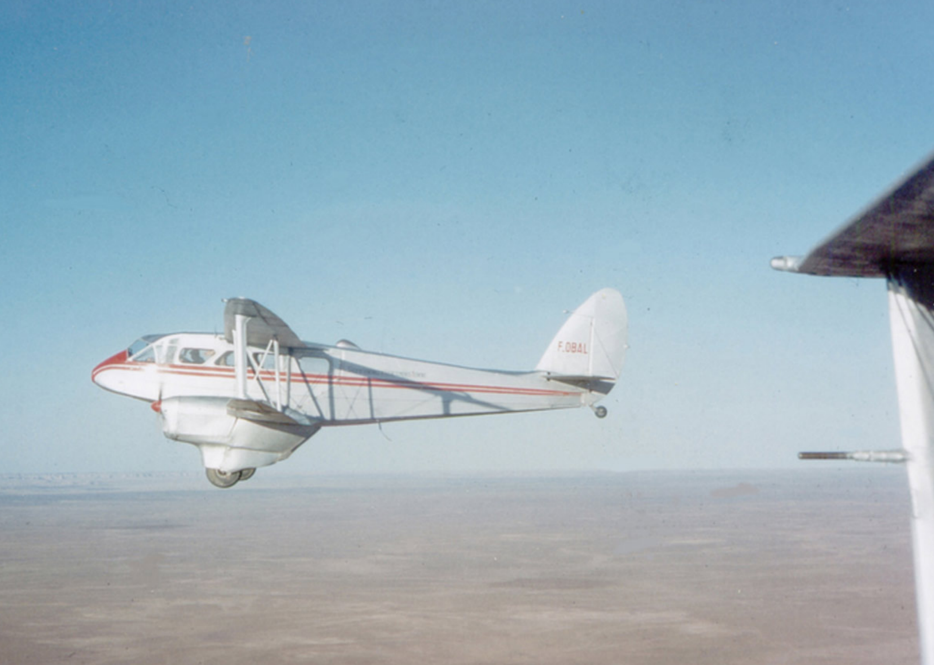
Dragon Rapide de la SGAA sur le Sahara en 1957 (Roland Richer de Forges)