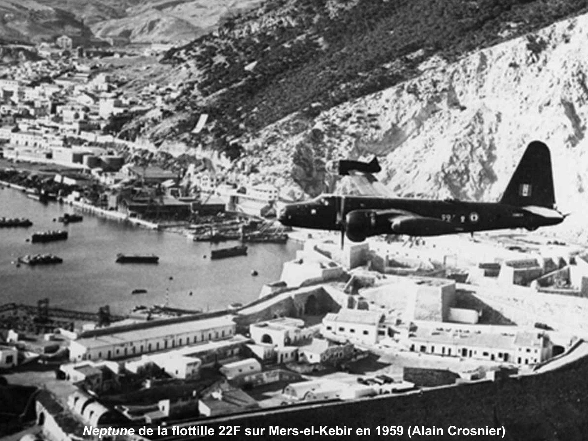
Neptune de la flottille 22F sur Mers-el-Kebir en 1959 (Alain Crosnier)