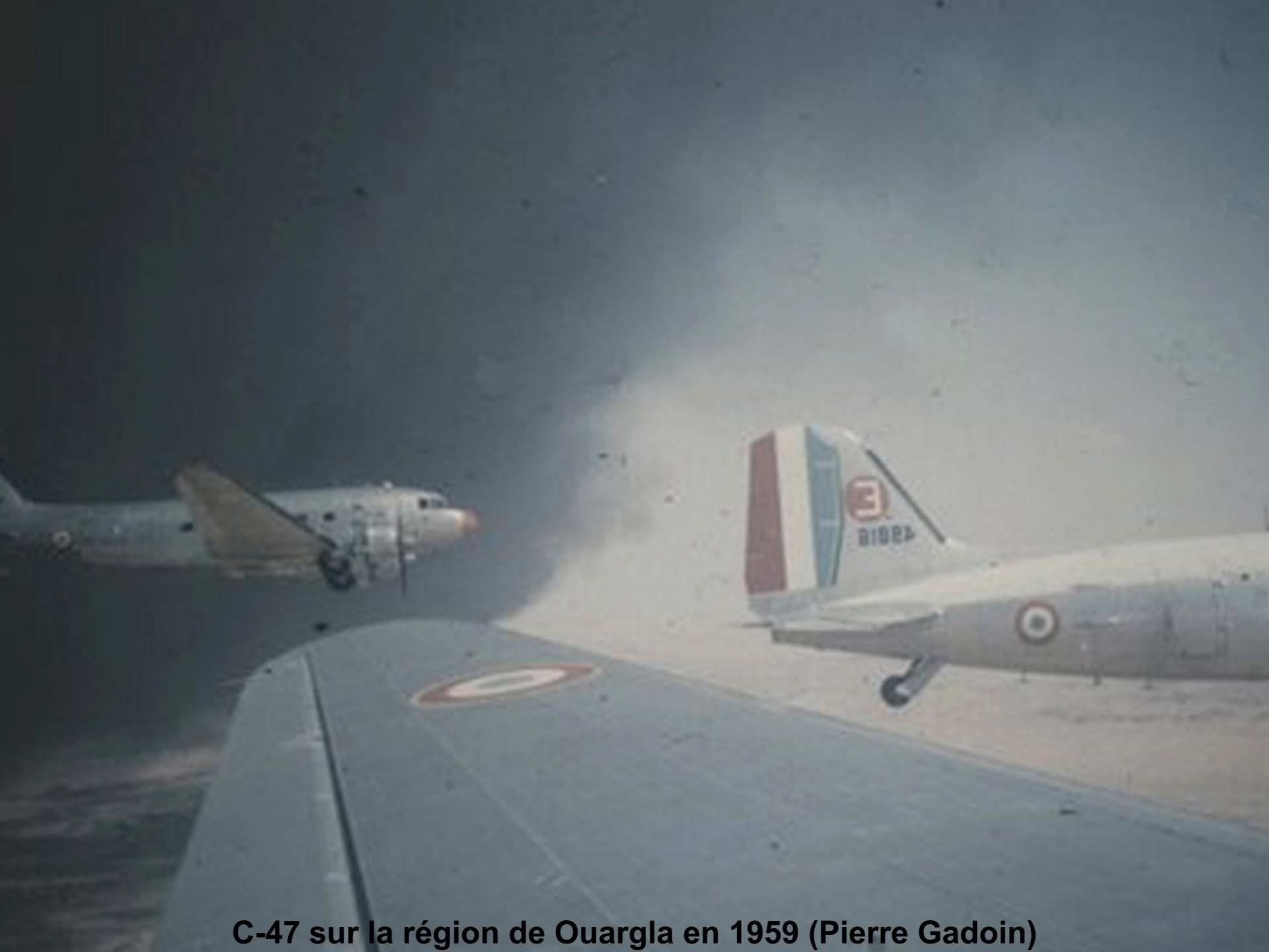
C-47 sur la région de Ouargla en 1959 (Pierre Gadoin)