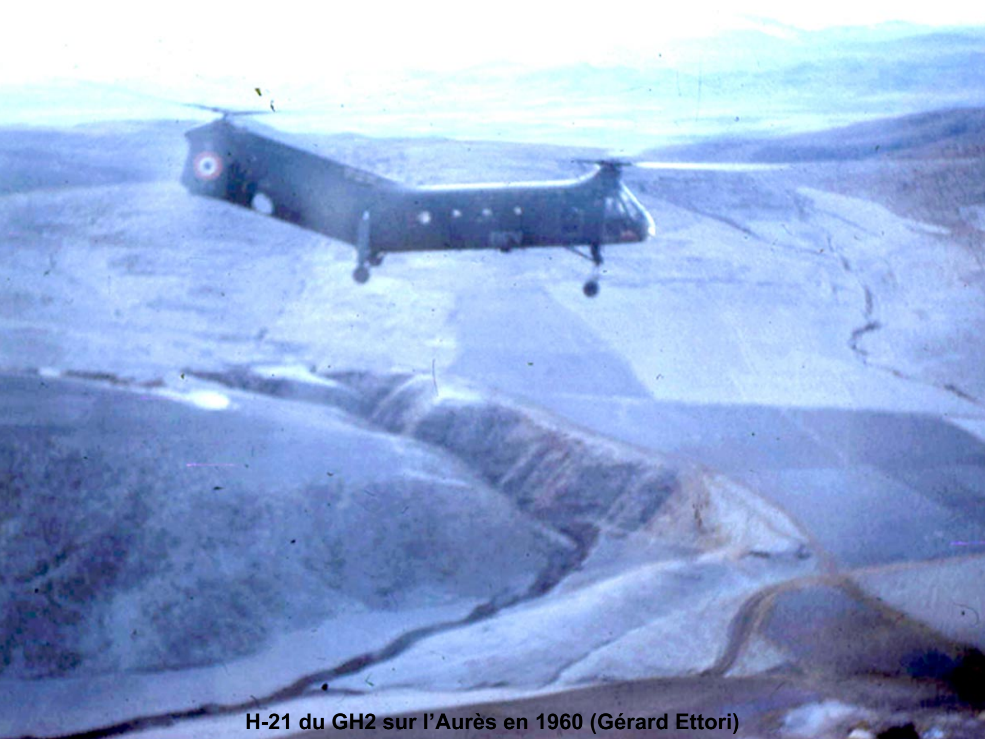
H-21 du GH2 sur l'Aurès en 1960 (Gérard Etori)