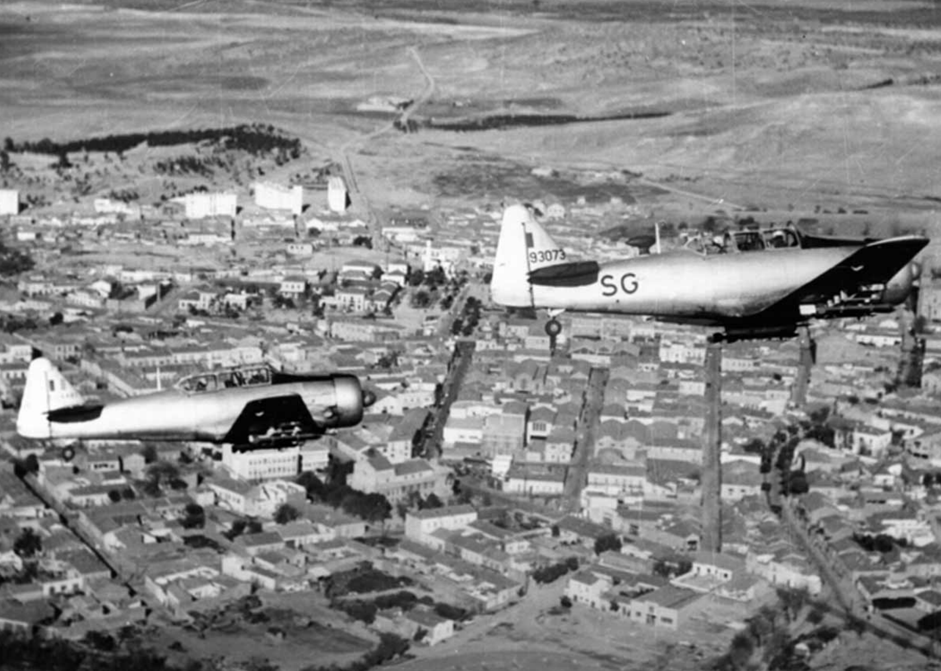
T-6 de l'EALA 20/72 sur Saïda en 1959 (Arthur Smet)