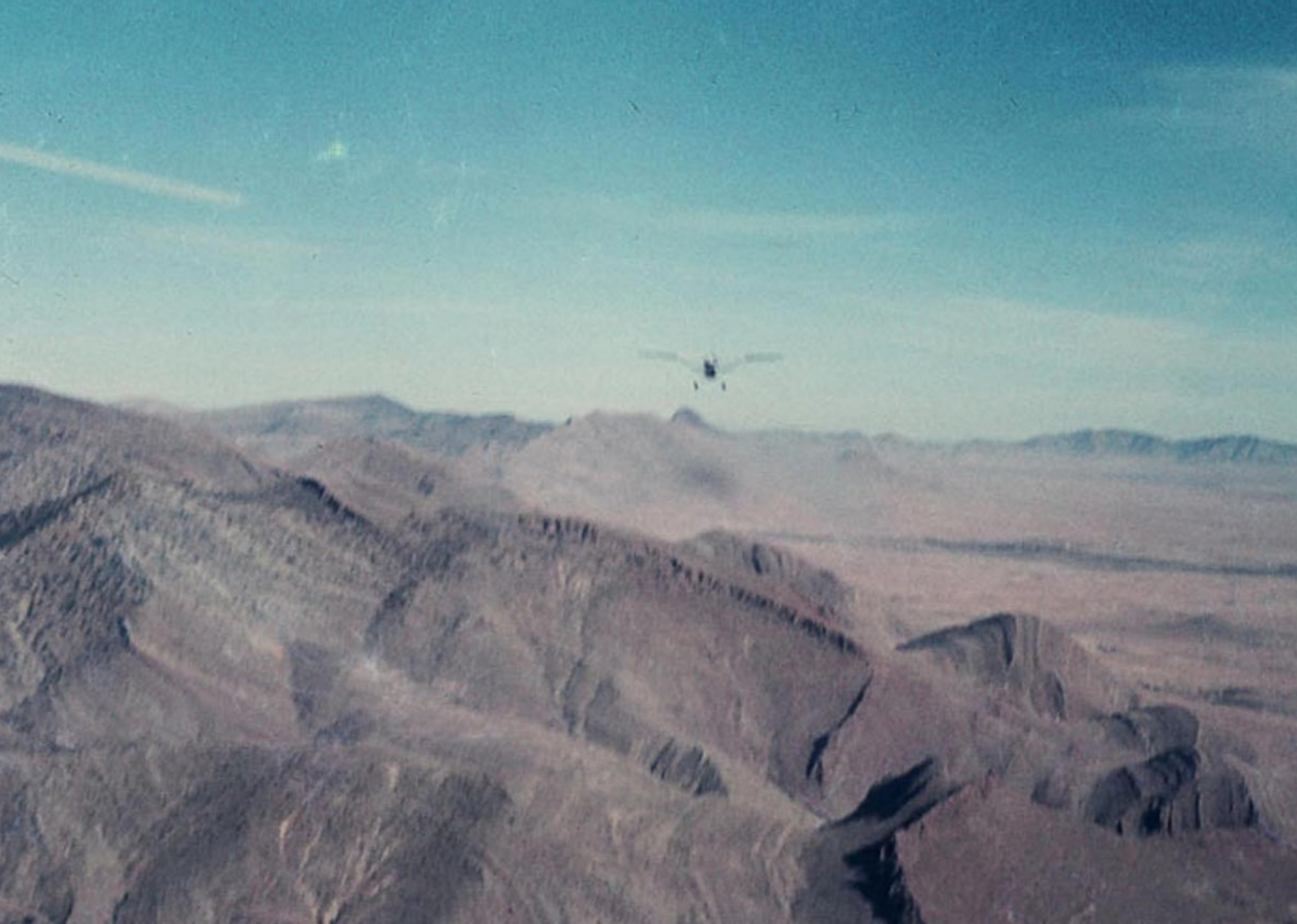
Cessna L-19 du 1er PMAH 21ème DI sur l'Aurès en 1960 (André Chauvière)