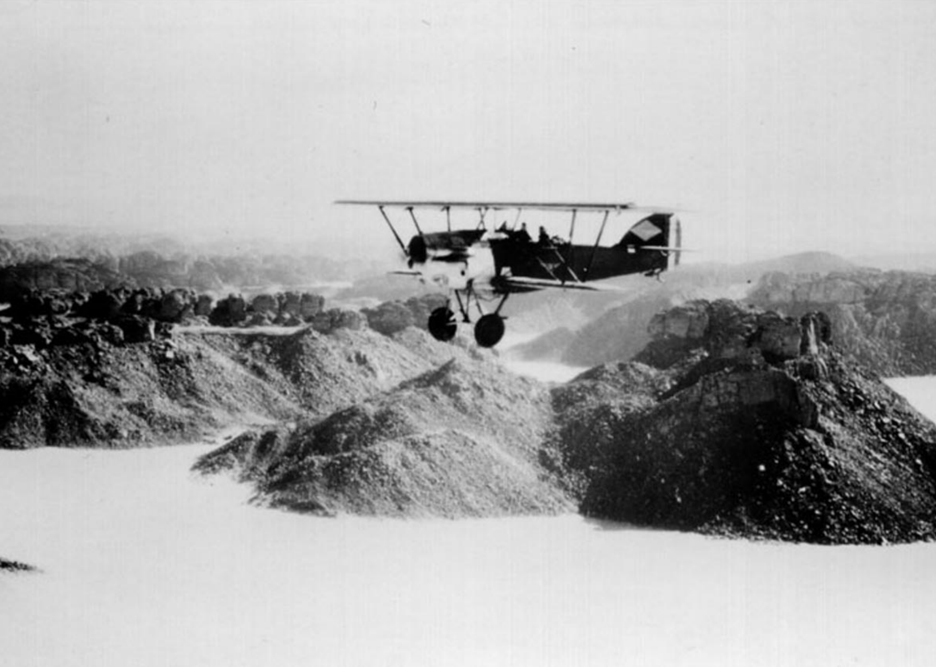
Potez 25 du 3ème GAA sur Djanet en 1935 (Paul Poinsot)