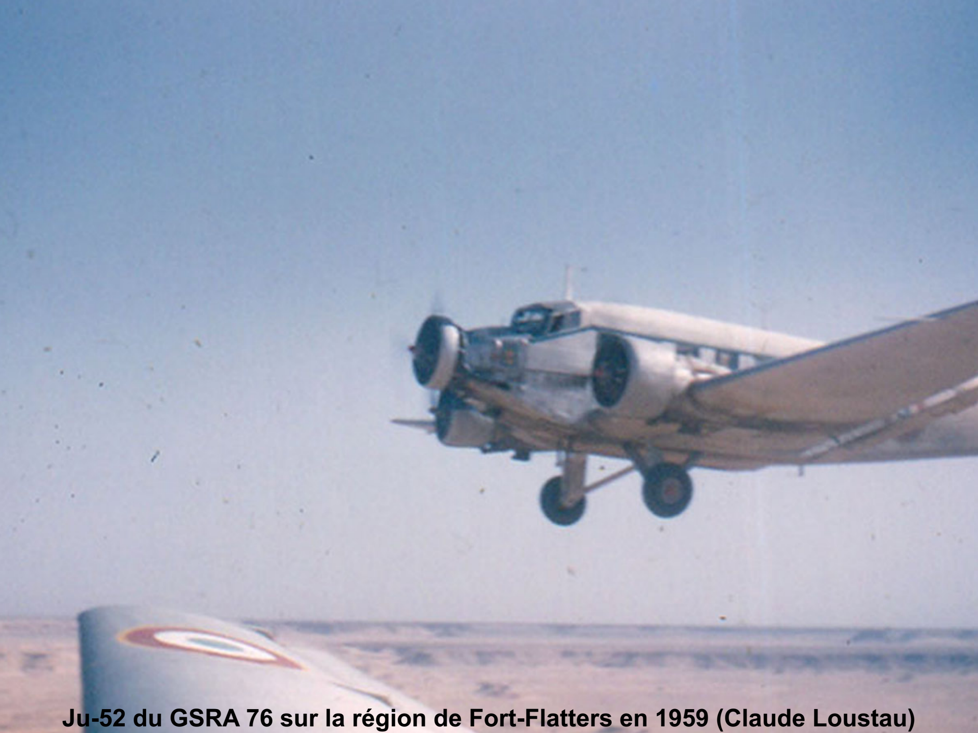
Ju-52 du GSRA 76 sur la région de Fort-Flatters en 1959 (Claude Loustau)