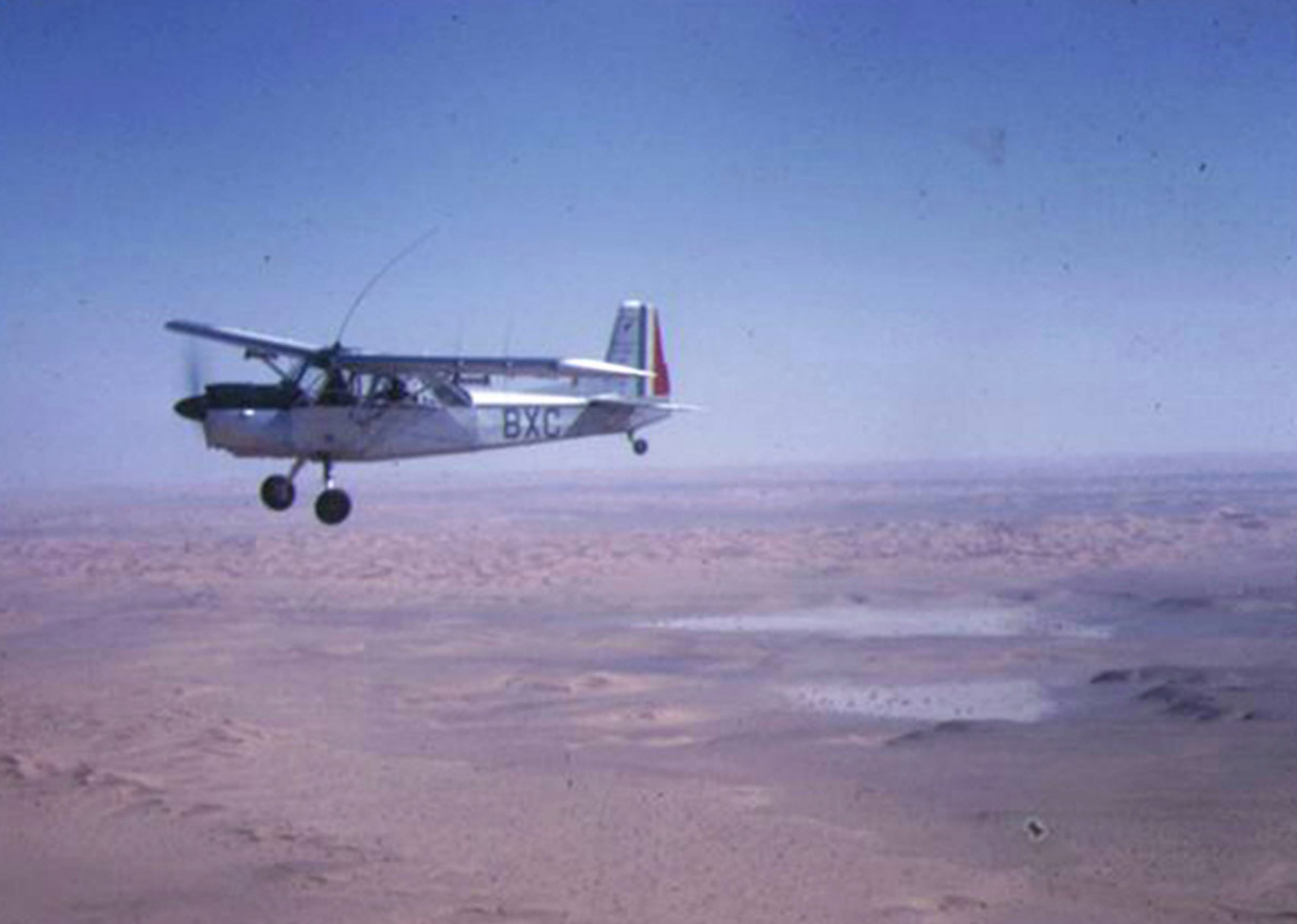
Nord 3400 du 1er PA ZOS sur la région d'Aïn-Séfra en 1960 (Philippe Desqueroux)