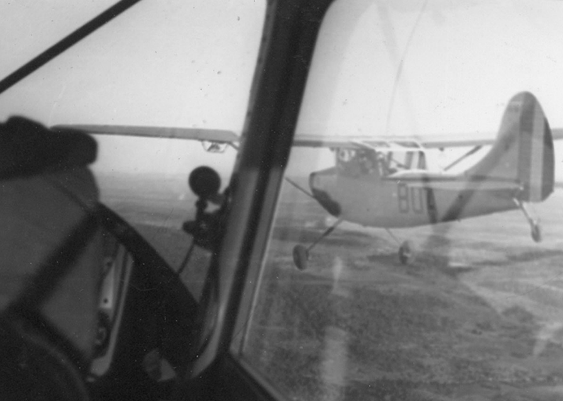
Cessna L-19 sur la région de Djelfa en 1961 (Pierre Jarrige)