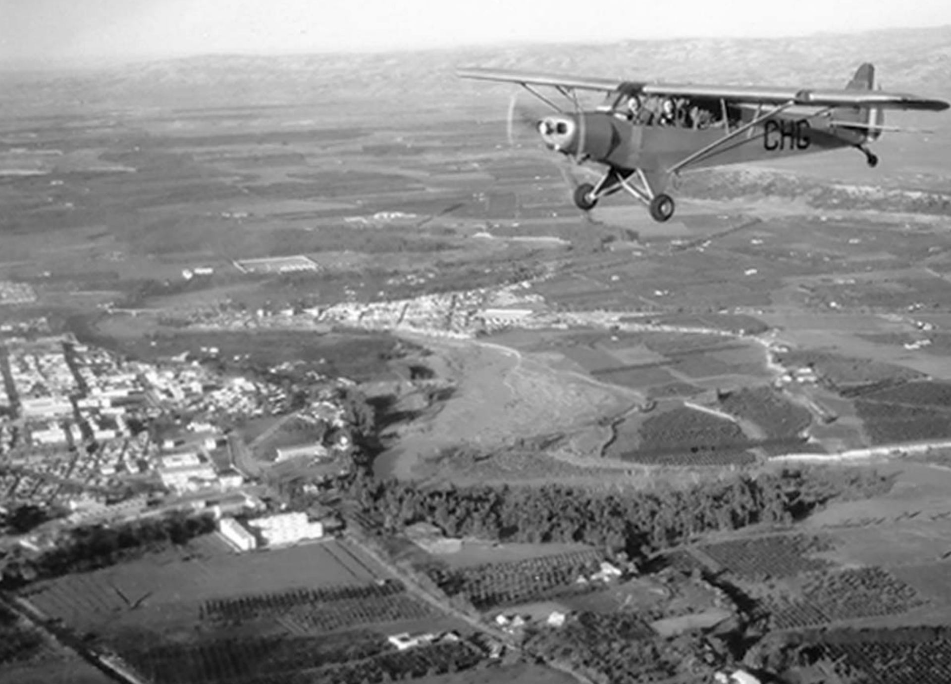
Piper L-18 sur la région d'Orléansville en 1959 (Bernard Gaudelas)