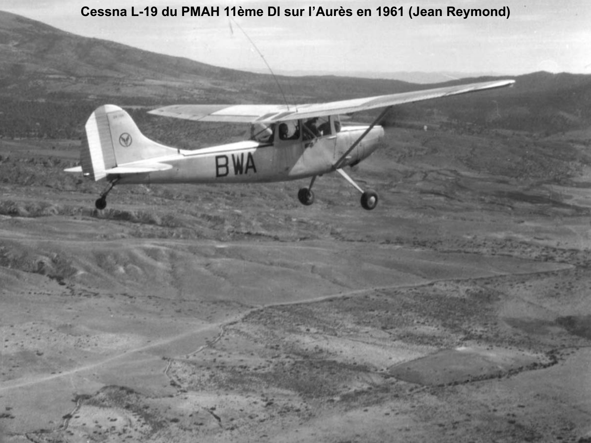
Cessna L-19 du PMAH 11ème DI sur l'Aurès en 1961 (Jean Reymond)