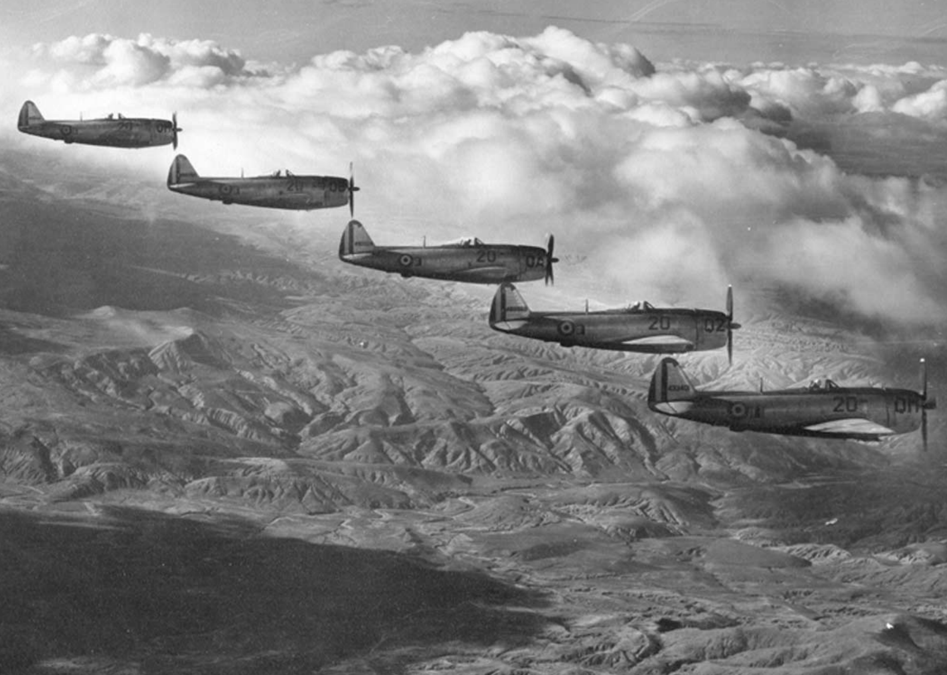
P-47 Thunderbolt de l'EC 2/20 sur l'Oranie en 1958 (Roland Didier)