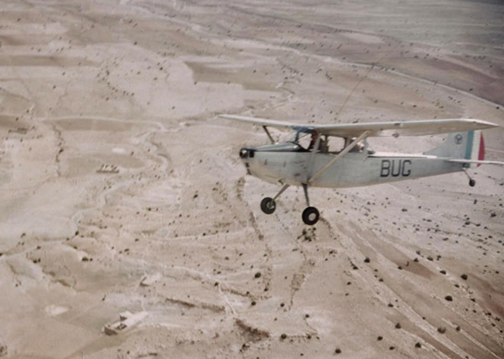
Cessna L-19 du 1er PMAH 21ème DI sur la région de l'oued Bou-Rich en 1960 (André Chauvière)