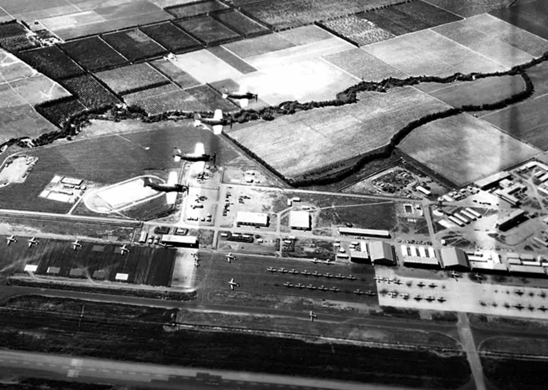
Skyraider de l'EC 1/20 sur l'aérodrome de Boufarik en 1960 (Christian Bernateau)