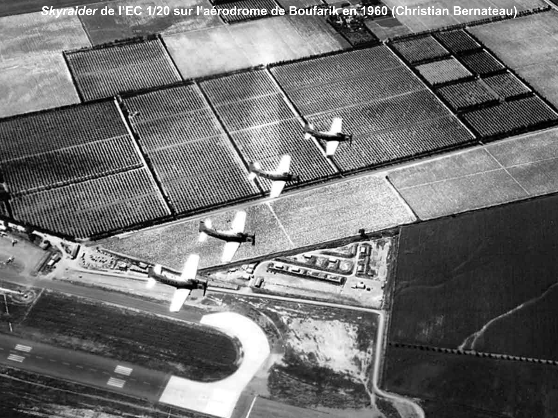
Skyraider de l'EC 1/20 sur l'aérodrome de Boufarik en 1960 (Christian Bernateau)