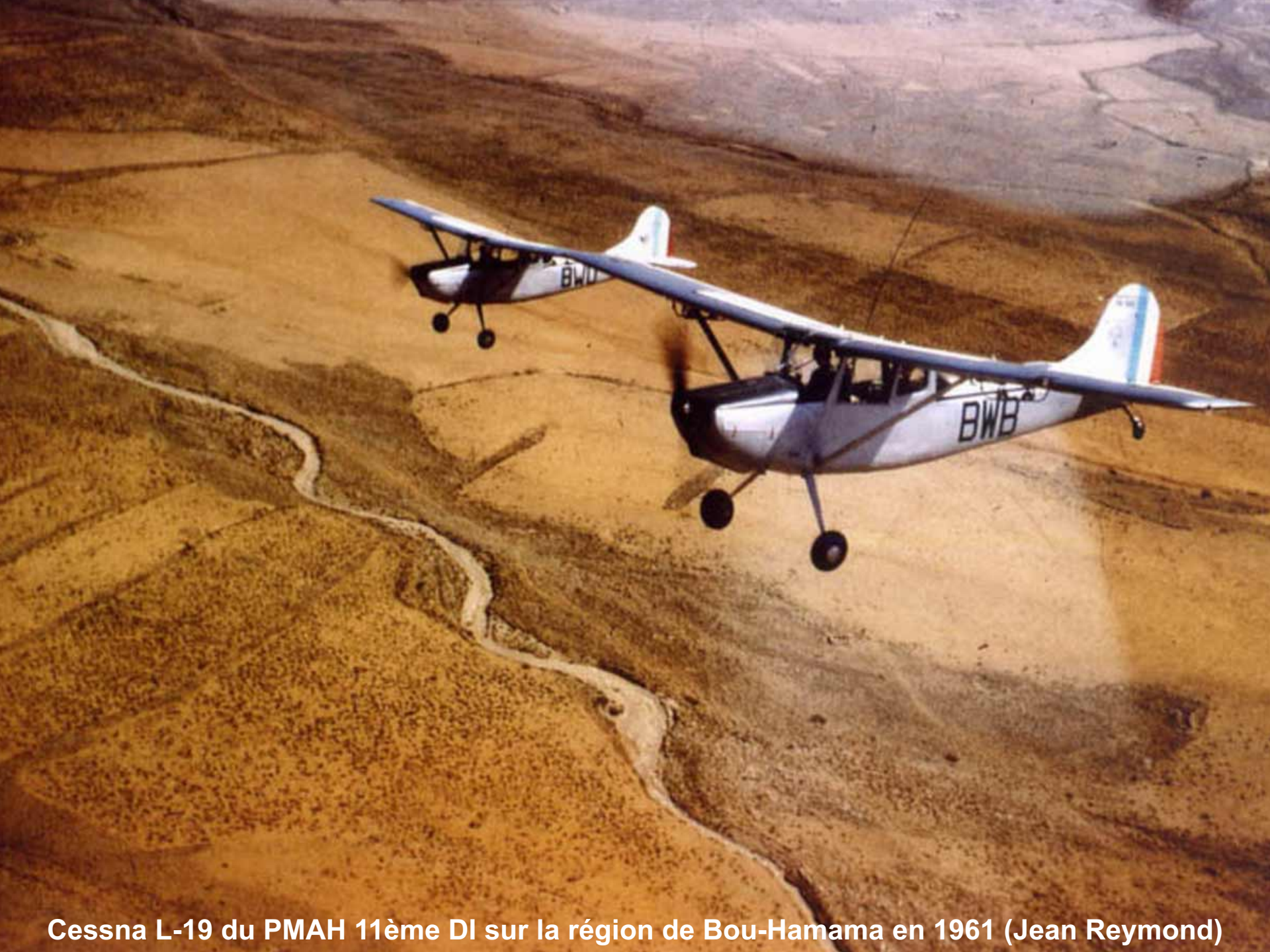
Cessna L-19 du PMAH 11ème DI sur la région de Bou-Hamama en 1961 (Jean Reymond)