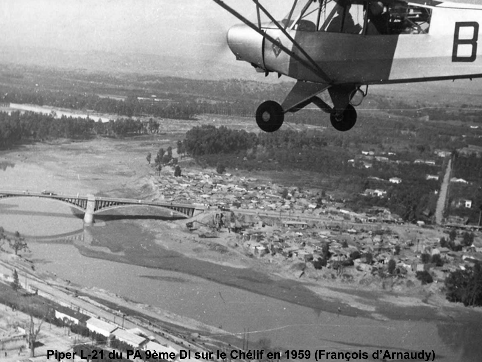
Piper L-21 du PA 9ème DI sur le Chélif en 1959 (François d'Arnaud)