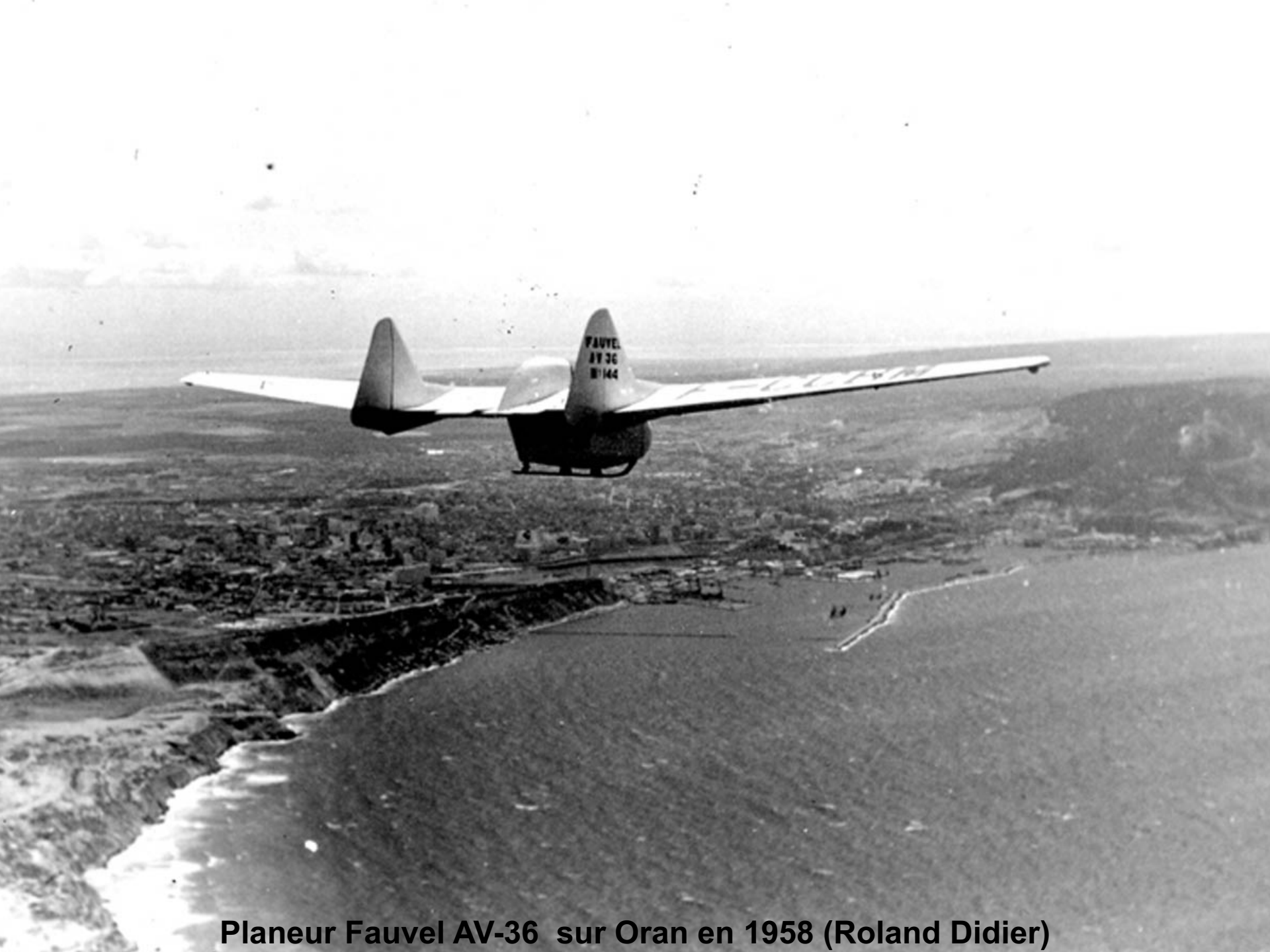
Planeur Fauvel AV-36 sur Oran en 1958 (Roland Didier)