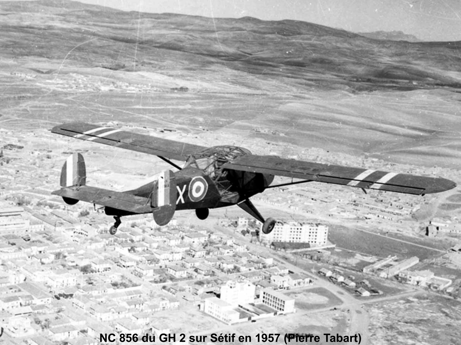
NC 856 du GH 2 sur Sétif en 1957 (Pierre Tabart)