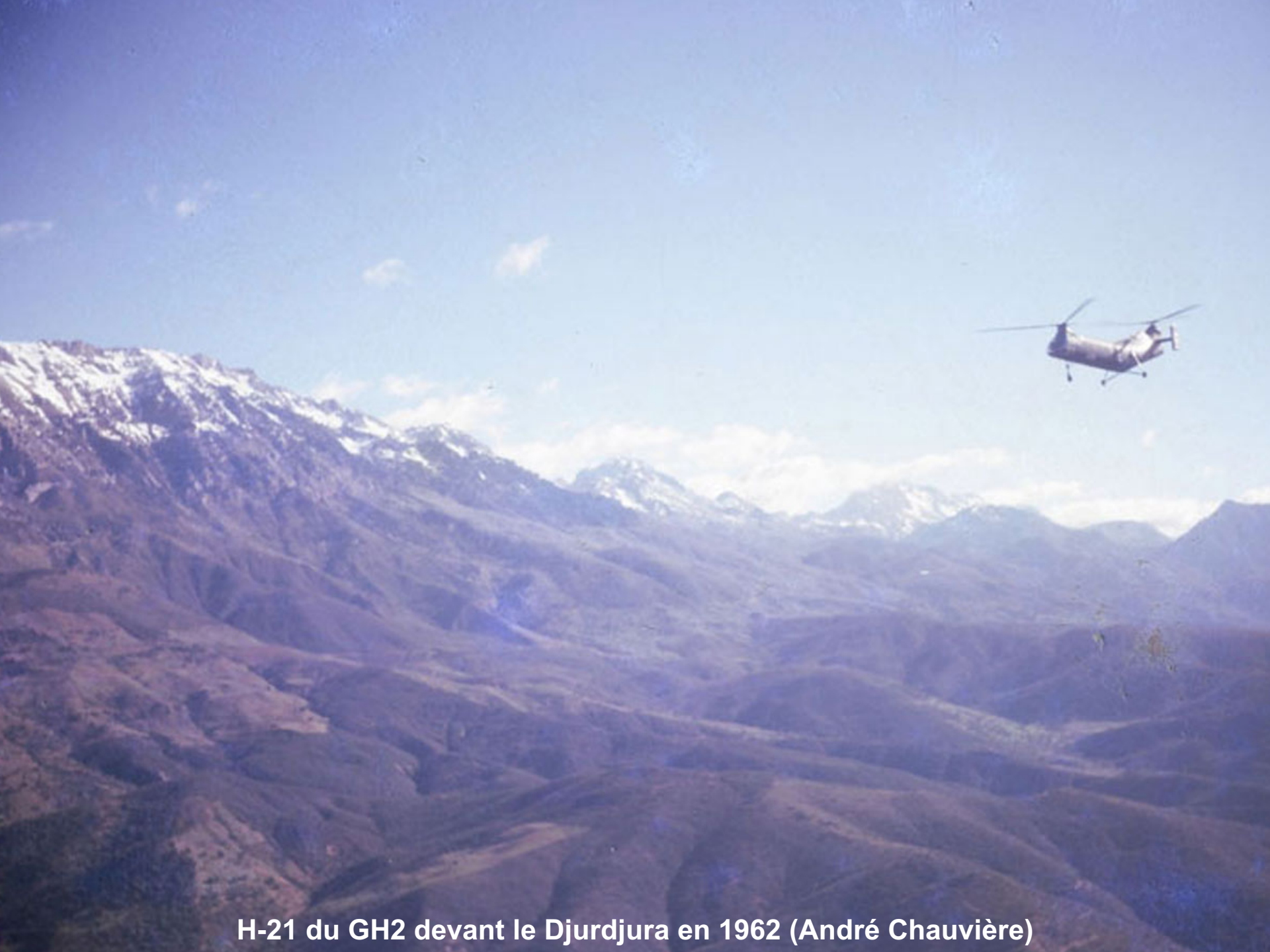
H-21 du GH2 devant le Djurdjura en 1962 (André Chauvière)