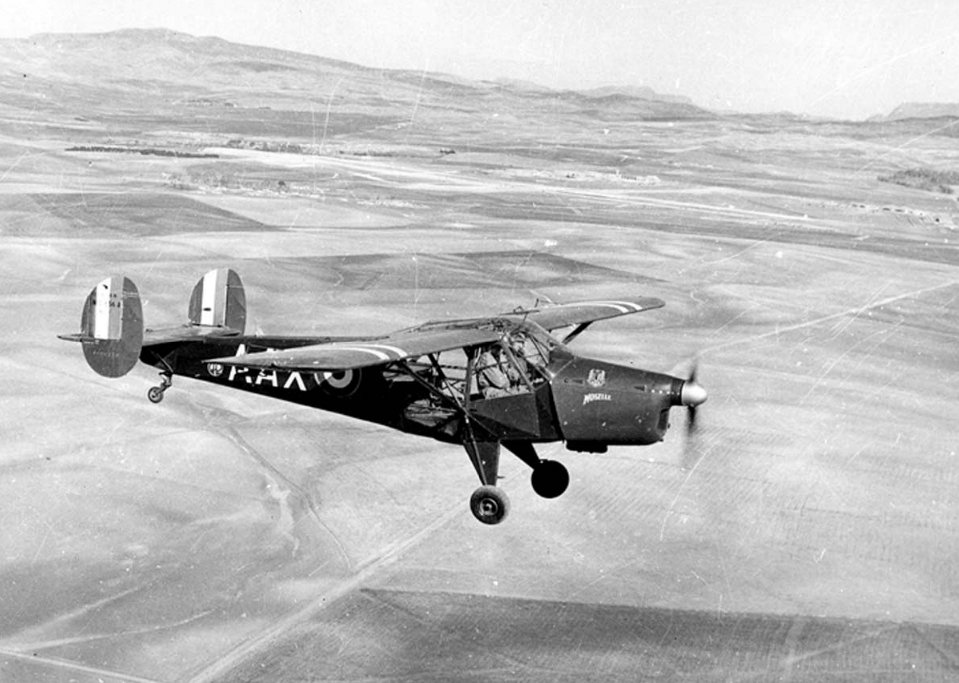
NC 856 du GH 2 sur la région de Sétif en 1957 (Pierre Tabart)