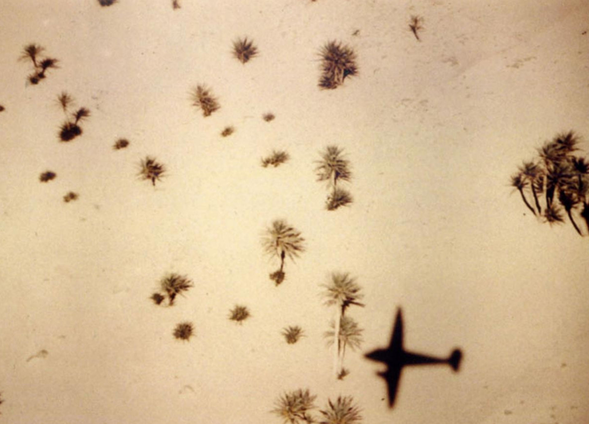
Ombre d'un Dragon Rapide de la SGAA sur une oasis (Roland Richer de Forges)