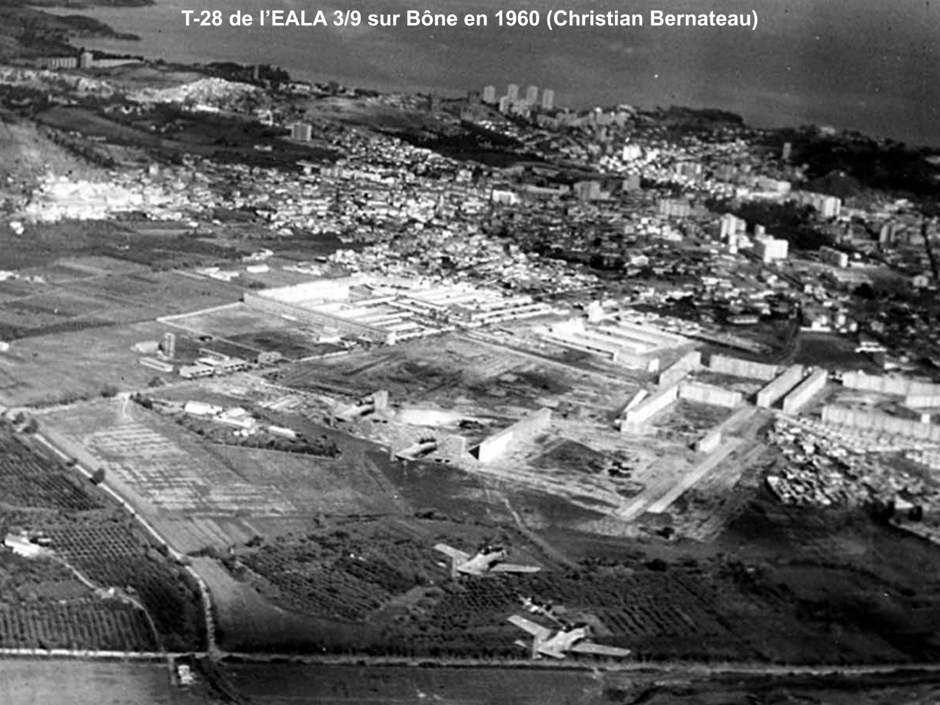
T-28 de l'EALA 3/9 sur Bône en 1960 (Christian Bernateau)