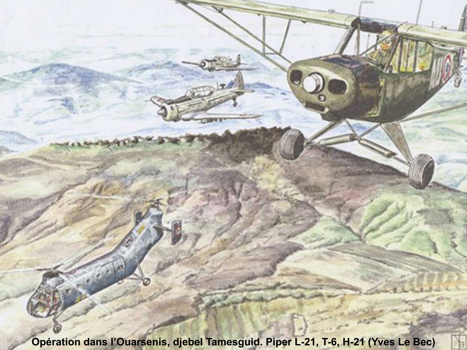
Opération dans l'Ouarsenis, djebel Tamesguid. Piper L-21, T-6, H-21 (Yves Le Bec)