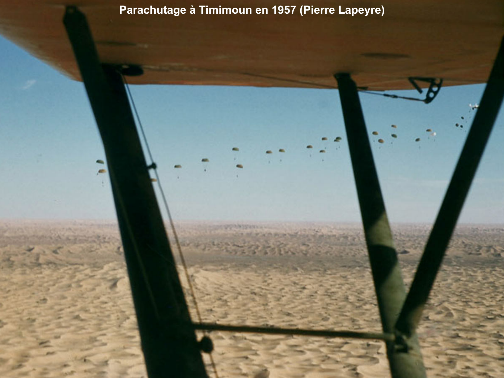
Parachutage à Timimoun en 1957 (Pierre Lapeyre)