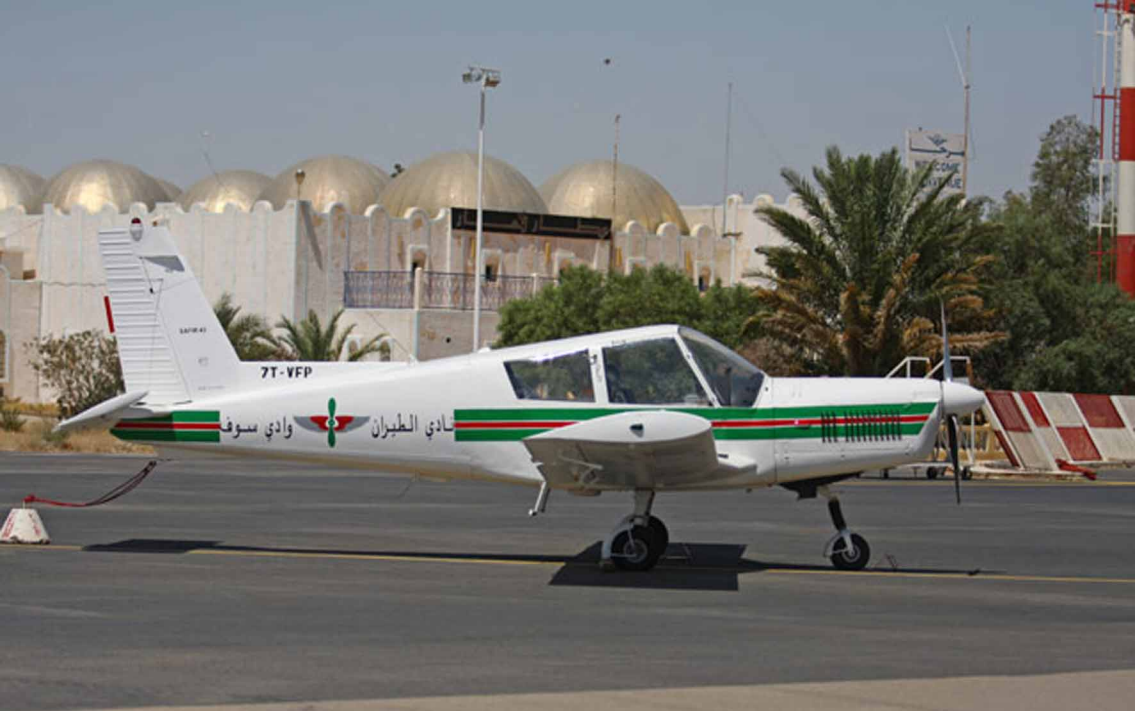
Le Zlin 42 de l'Aéro-club d'El-Oued