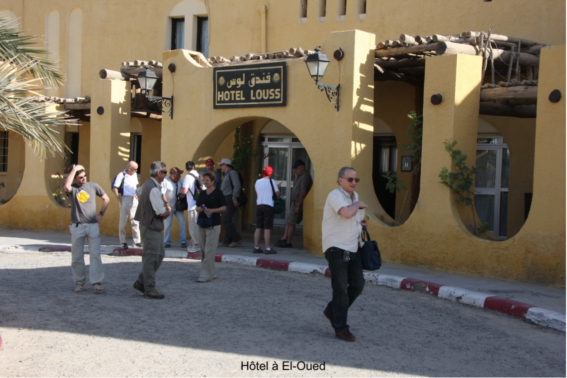
Hôtel à El-Oued