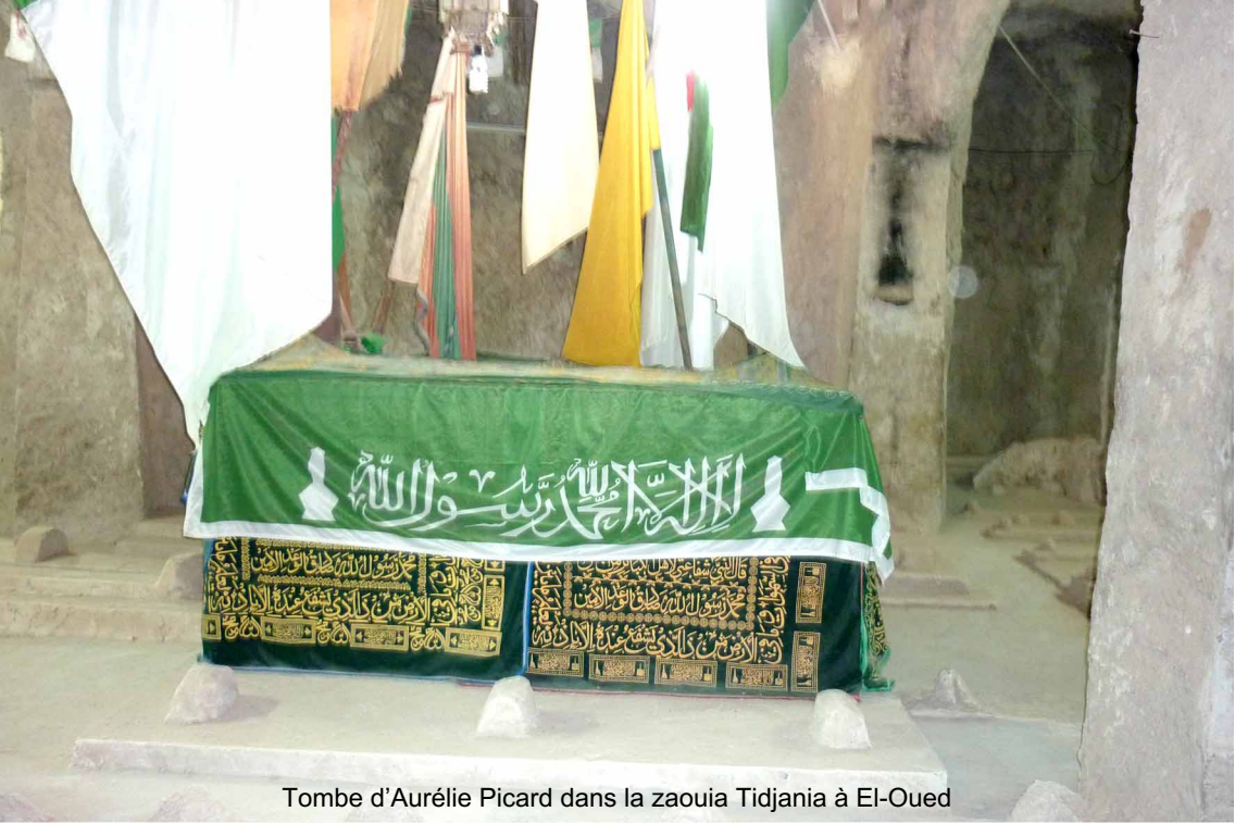
Tombe d'Aurélie Picard dans la zaouia Tidjania à El-Oued