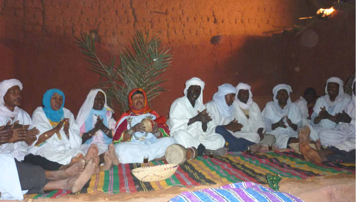
Folklore à Timimoun