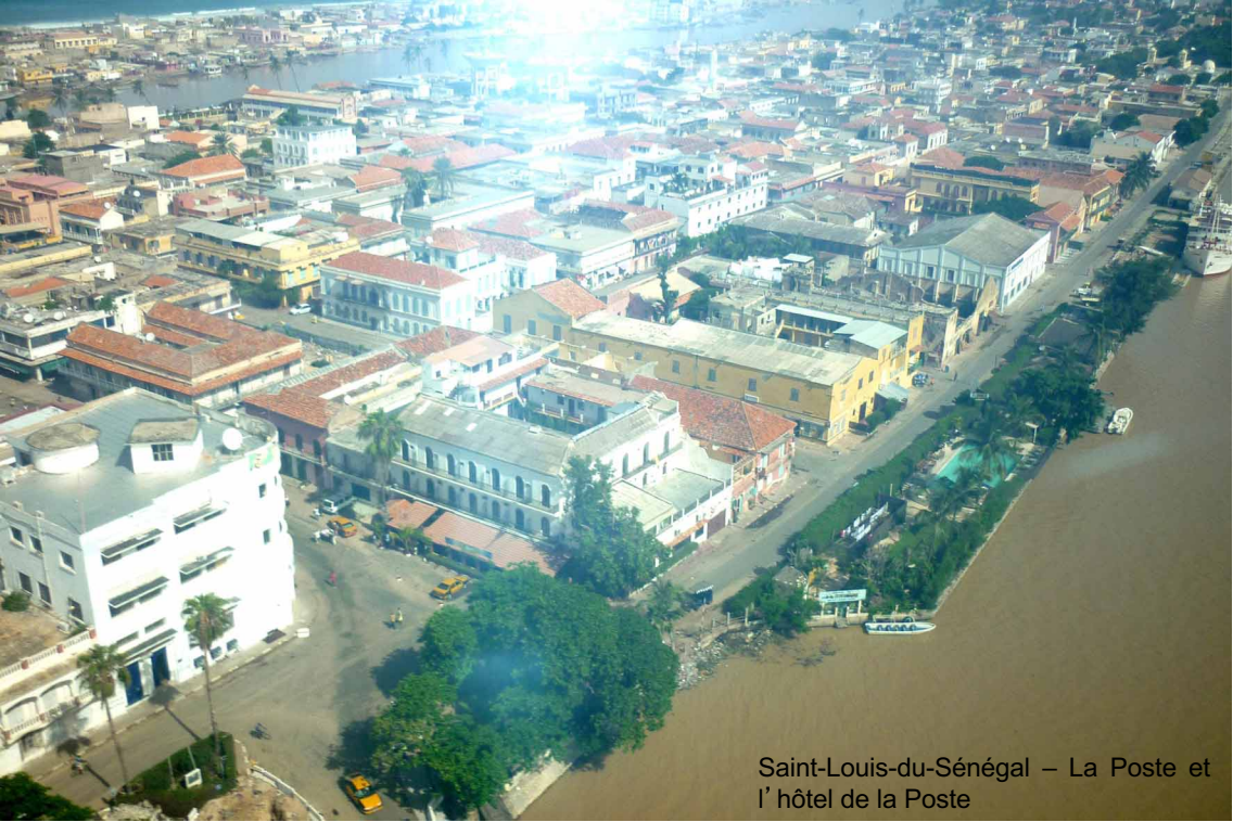
Saint-Louis-du-Sénégal – La Poste et l'hôtel de la Poste