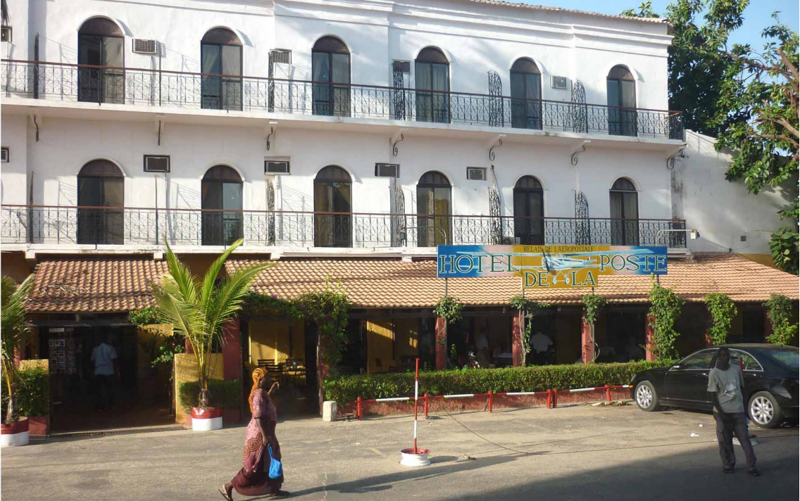
L' hôtel de la Poste accueille le Rallye