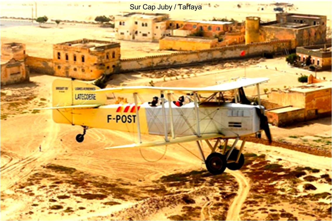
Sur Cap Juby / Tarfaya