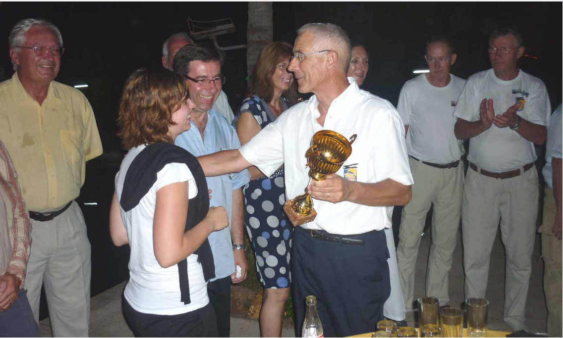
Remise des prix du classement intermédiaire à Saint-Louis – Le Rallye et le Breguet arriveront à Toulouse le 1 er octobre 2010 pour une réception au Capitole Dernière diapositive