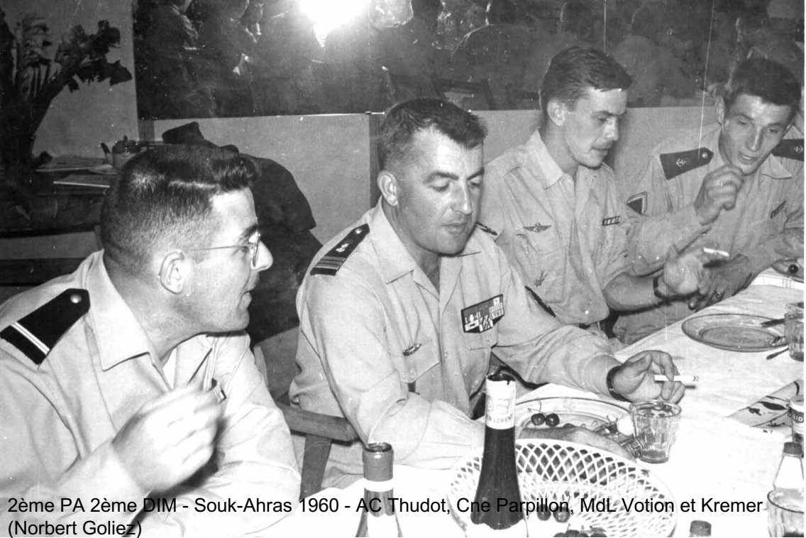
2ème PA 2ème DIM - Souk-Ahras 1960 - AC Thudot, Cne Parpillon, MdL Votion et Kremer. (Norbert Goliez)