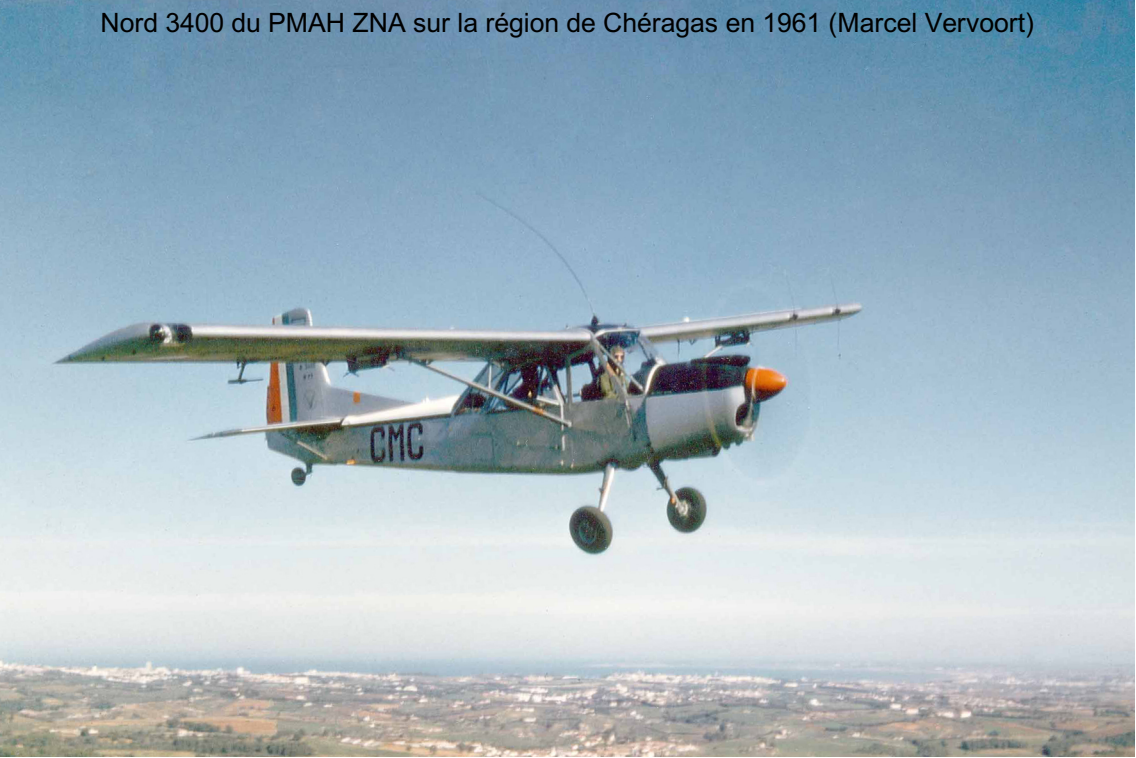
Nord 3400 du PMAH ZNA sur la région de Chéragas en 1961 (Marcel Vervoort)