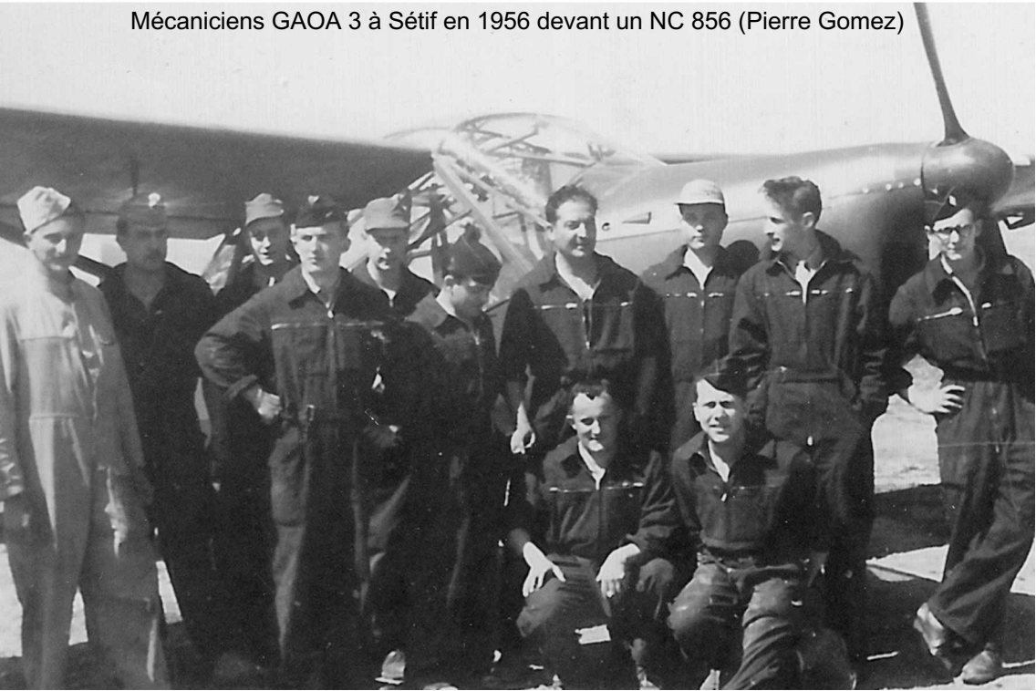
Mécaniciens GAOA 3 à Sétif en 1956 devant un NC 856 (Pierre Gomez)