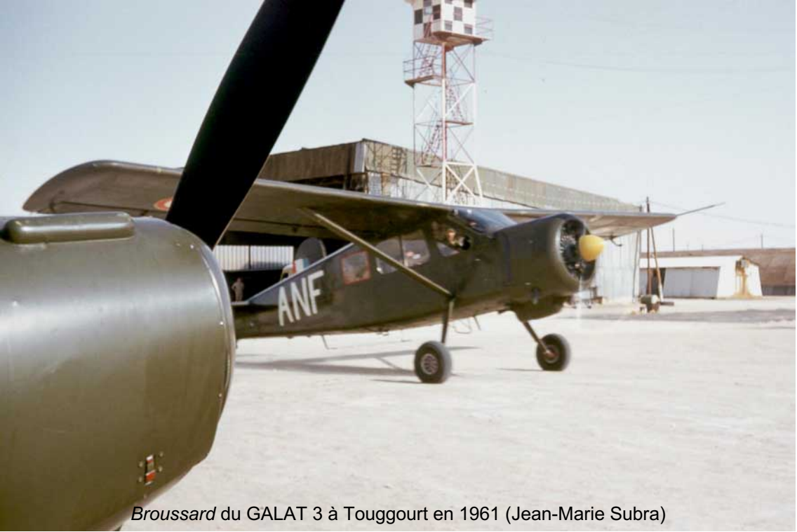
Broussard du GALAT 3 à Touggourt en 1961 (Jean-Marie Subra)