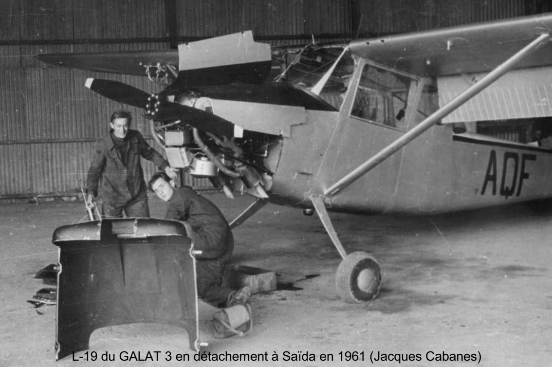
L-19 du GALAT 3 en détachement à Saïda en 1961 (Jacques Cabanes)