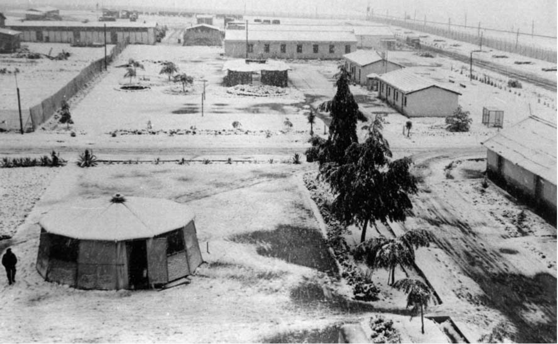
1er PA 2ème DIM à Guelma – Hiver 1961 (Gérard Godot)