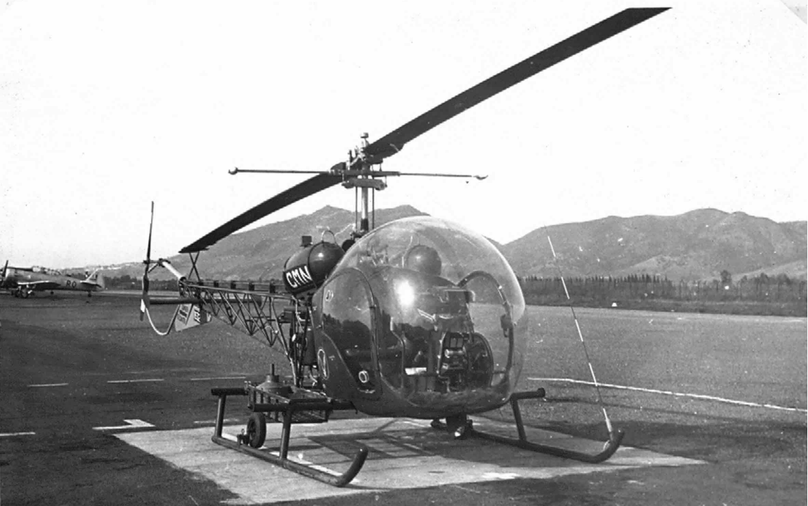
Bell G2 du PMAH ZNA à Tizi-Ouzou en 1961 (Gérard Wittemer)