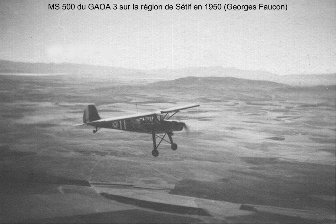
MS 500 du GAOA 3 sur la région de Sétif en 1950 (Georges Faucon)