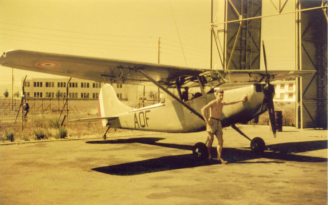
Pierre Tabart devant un L-19 du GALAT 3 à Bizerte-Sidi Ahmed en juillet 1961 (Pierre Tabart)