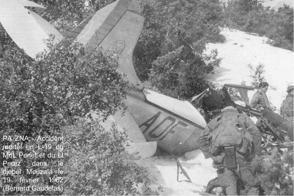
PA ZNA - Accident mortel en L-19 du MdL Penet et du Lt Perez dans le djabel Mouzaïa le 19 février 1962 (Bernard Gaudelas)