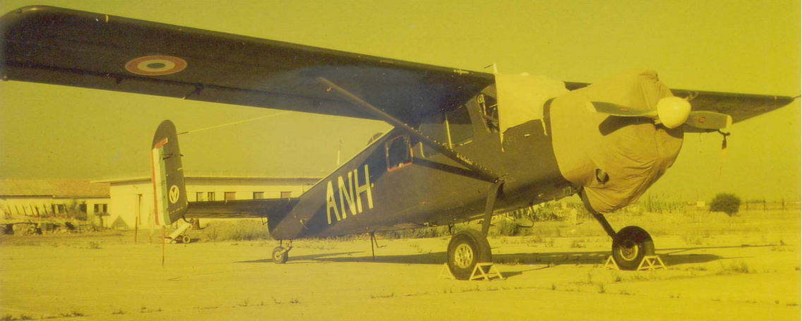
Broussard du GALAT 3 à Sidi-Ahmed après l' affaire de Bizerte en juillet 1961 (Pierre Tabart)