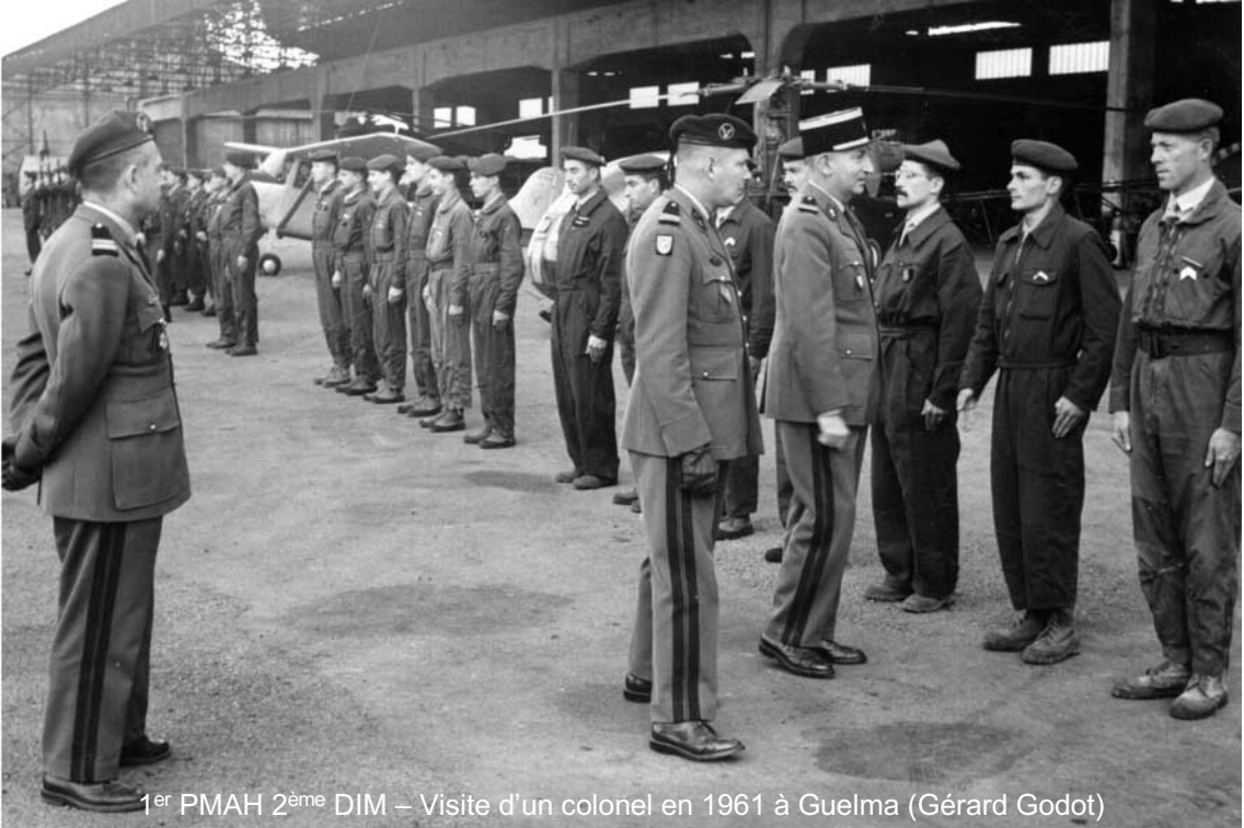
1 er PMAH 2 ème DIM – Visite d'un colonel en 1961 à Guelma (Gérard Godot)