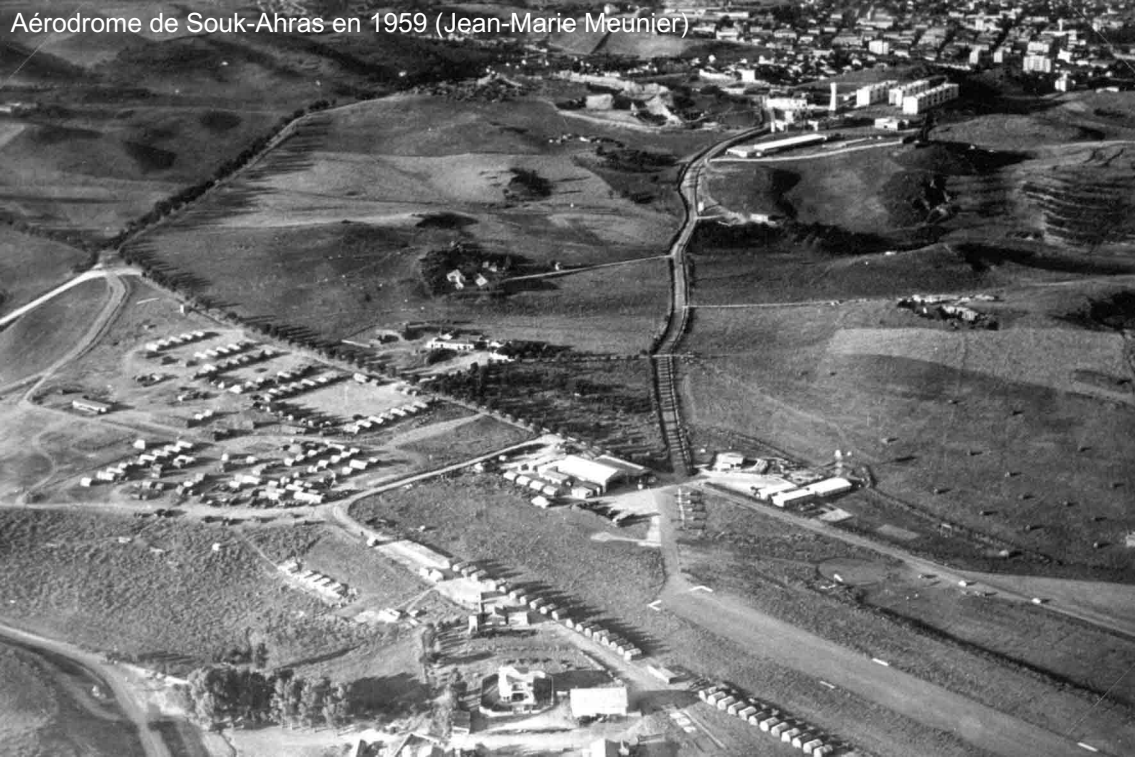
Aérodrome de Souk-Ahras en 1959 (Jean-Marie Meunier)