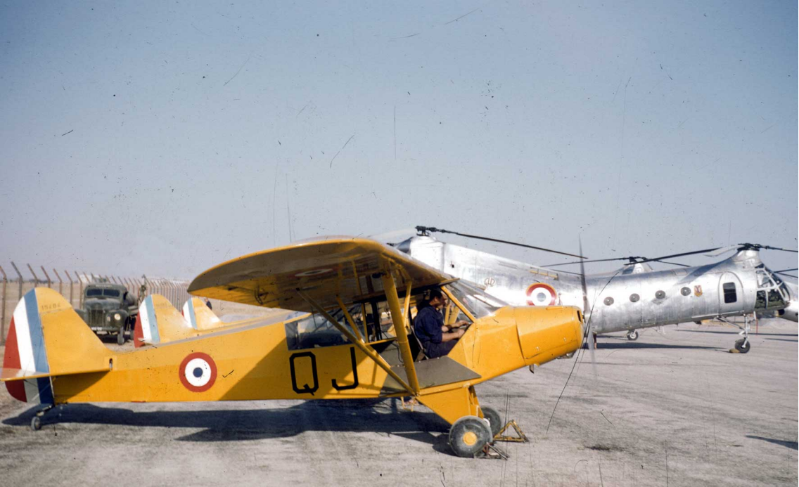
Piper L-18 du GAOA 3 devant un H-21 à Sétif en 1957 (Daniel Jeandel)