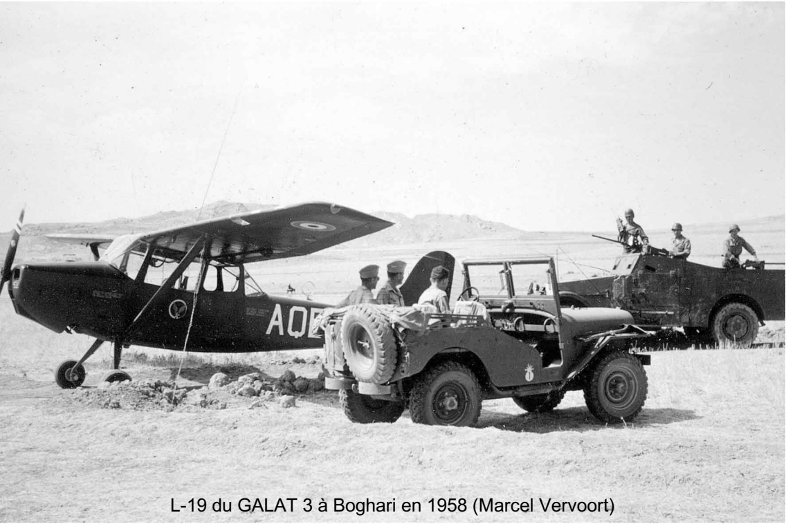
L-19 du GALAT 3 à Boghari en 1958 (Marcel Vervoort)