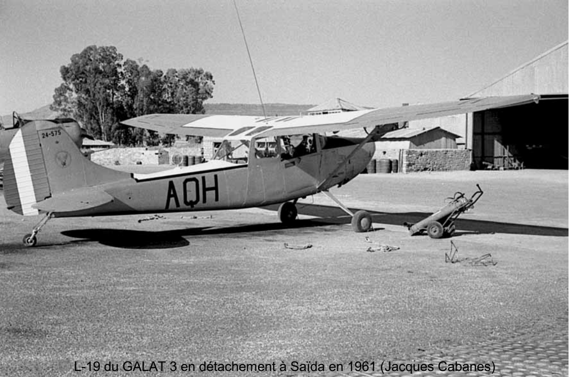
L-19 du GALAT 3 en détachement à Saïda en 1961 (Jacques Cabanes)