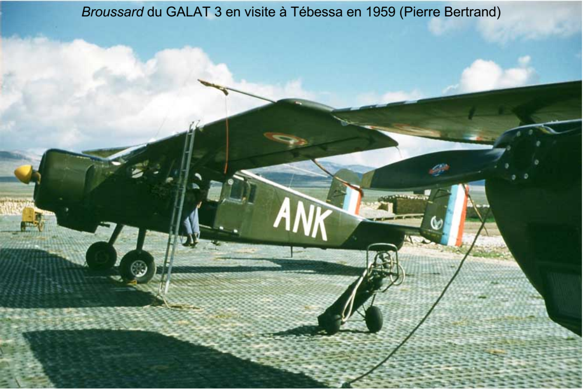
Broussard du GALAT 3 en visite à Tébessa en 1959 (Pierre Bertrand)