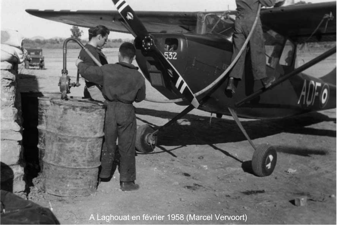
A Laghouat en février 1958 (Marcel Vervoort)