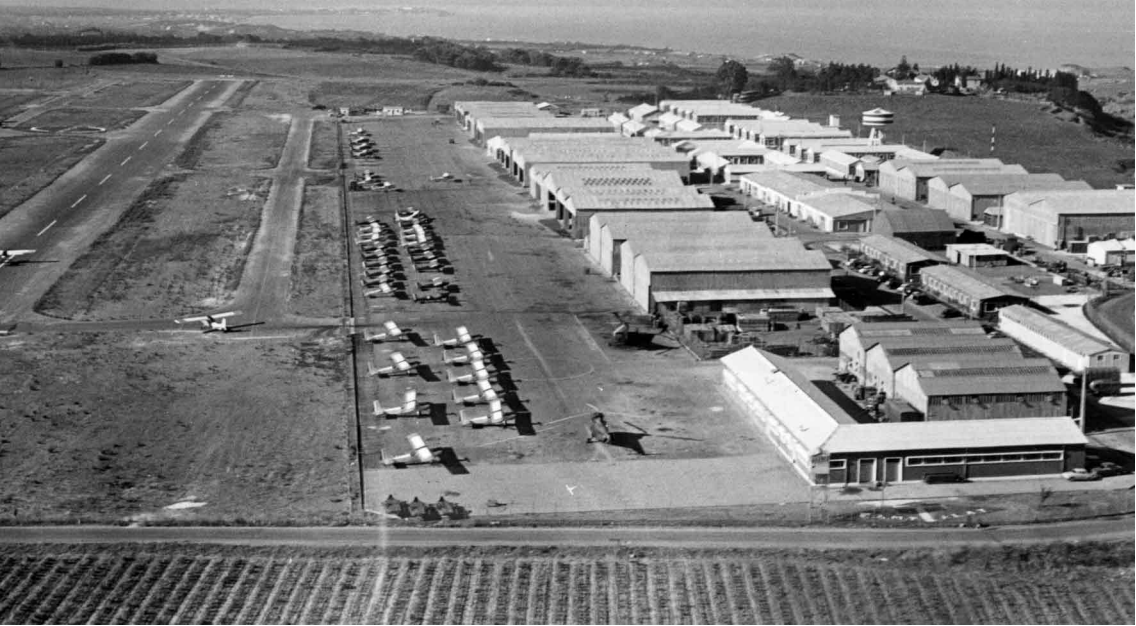
Les installations du GALAT 3 à Chéragas en 1960 (Marcel Vervoort)