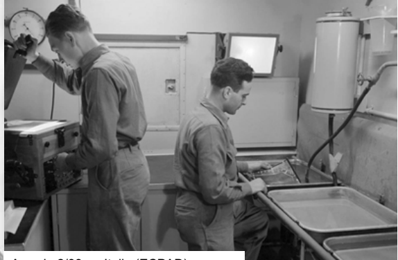
Avec le 2/3 en Italie