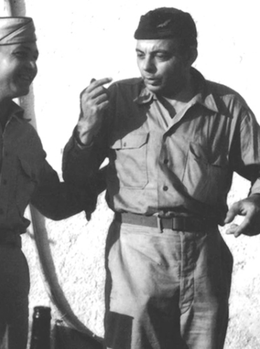
Antoine de Saint-Exupéry en Corse avec le 2/33