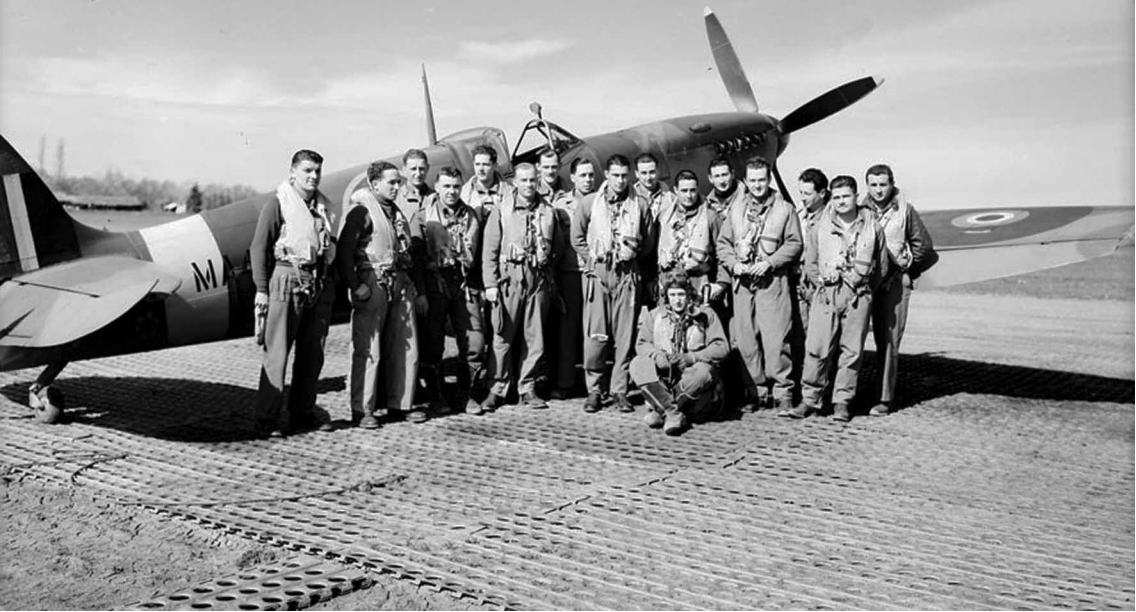
Pilotes du GC 1/7 à Taher