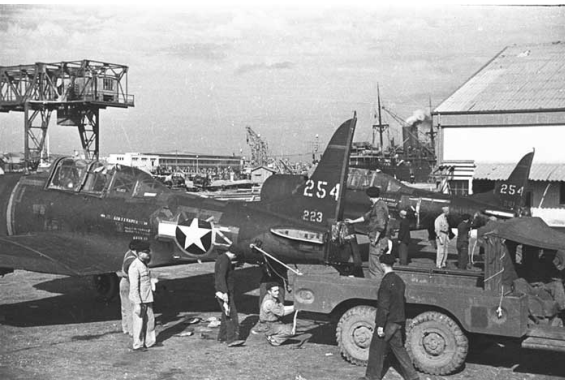
En octobre 1943, livraison à Casablanca de Douglas A-24 Dauntless destinés à l'armée de l'Air

Le ministère de l'Air du gouvernement provisoire à Alger décide, en juillet 1944, de créer des unités destinées à soutenir les combats du Maquis en métropole en ravitaillant les postes FFI et en harcelant les colonnes allemandes en retraite.