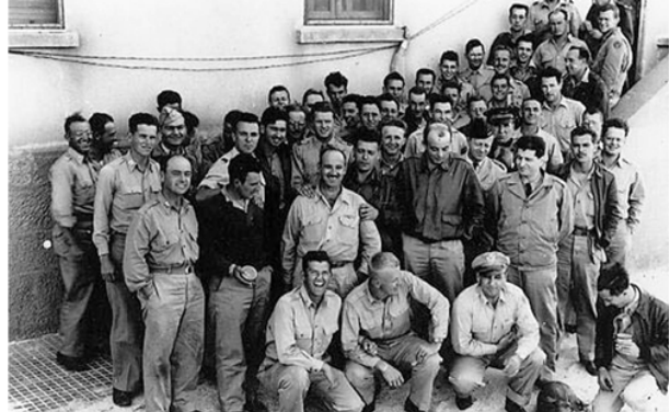
Ci-dessus : Antoine de Saint-Exupéry au Canada avant son arrivée en Algérie et avec le 23rd Photo Squadron en juin 1944 Ci-dessous : F-5 du GR 2/33