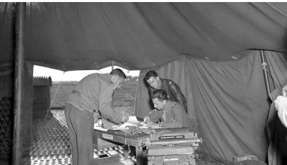
A Sidi-Ahmed (ECPAD)

Le Cdt Arnaud, commandant le Groupe 2/5 La Fayette , à Sidi-Ahmed en juillet 1943 (ECPAD)