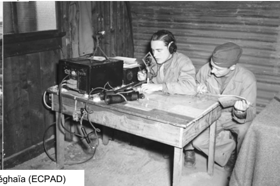
Le GC 2/3 à La Réghaïa