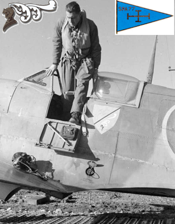
Spitfire du GC 1/7 à Taher