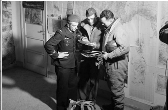
Avec le 2/33 en Italie