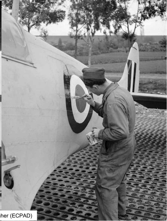
GC 1/7 à Taher