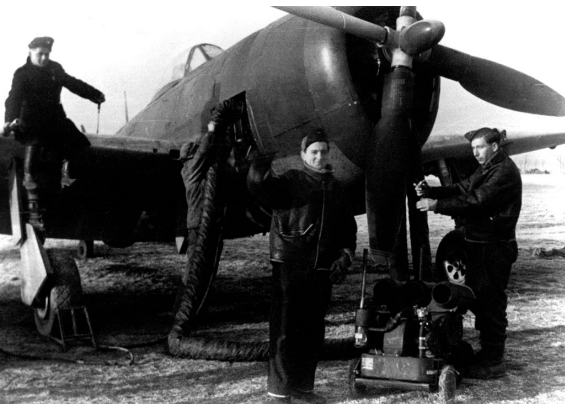
Les mécaniciens du 3/3 en Europe, autour d'un P-47

Il fait mouvement, le 30 avril 1944 sur Oran-La Sénia, puis sur Bône-Les Salines où il est intégré au Bône Fighter Command et reçoit treize P-40 en mai 1944 et des P-39M Aircobra en septembre 1944. Transféré à La Réghaïa, le Groupe reçoit quelques pilotes venant de la Première Flottille de l'Aéronautique Navale. Le 5 juillet 1944, il commence à recevoir des P-47D Thunderbolt dont il sera entièrement équipé le 30 août et avec lesquels il se posera à Istres.