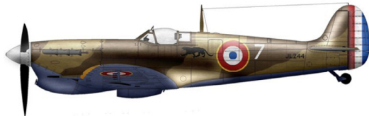
Spitfire V du GC 2/7 Nice par Cédric Chevalier