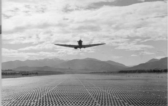
Spitfire du GC 1/7 à Taher