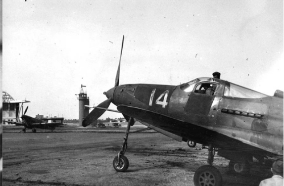
P-39 de la 2ème escadrille du GC 3/6 (Raymond Macia)