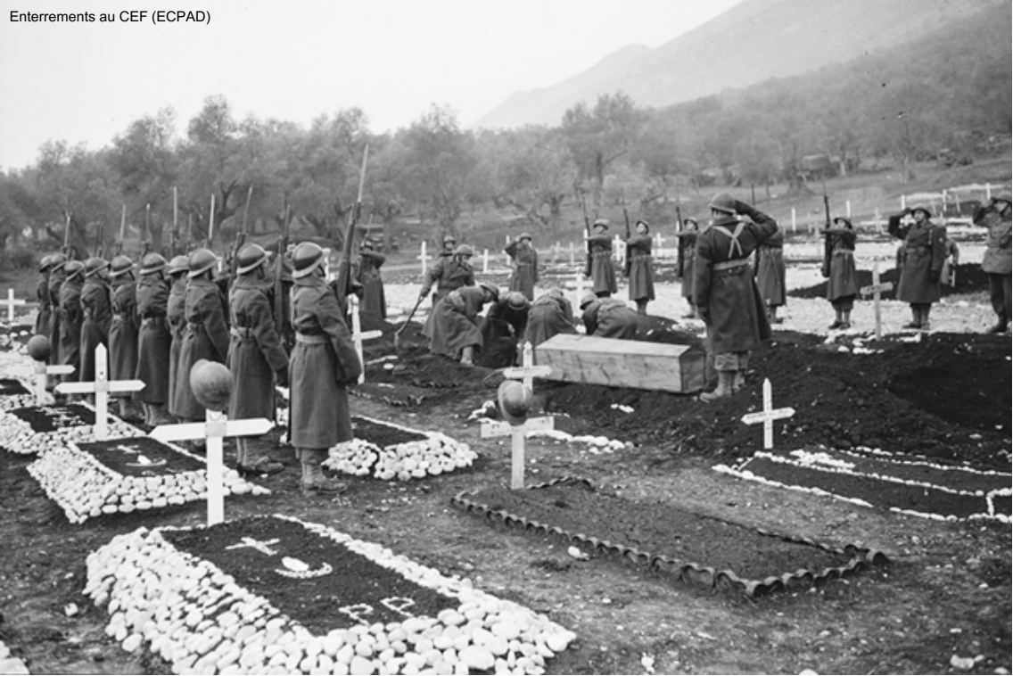
Enterrements au CEF