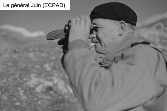
Le général Juin