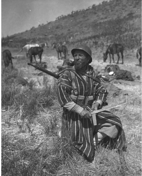
Embarquement, pour l'île d'Elbe, de la 9ème Division d'infanterie coloniale et Goumier affutant sa baïonnette