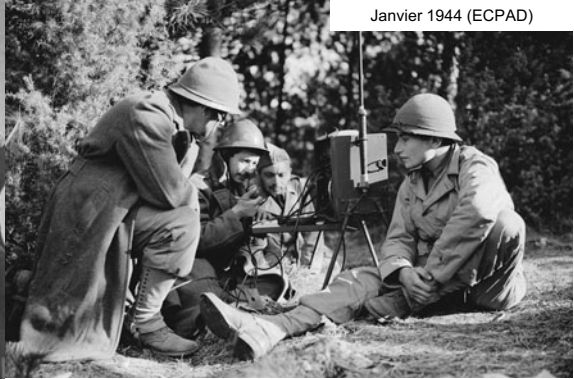
Dans Castelforte