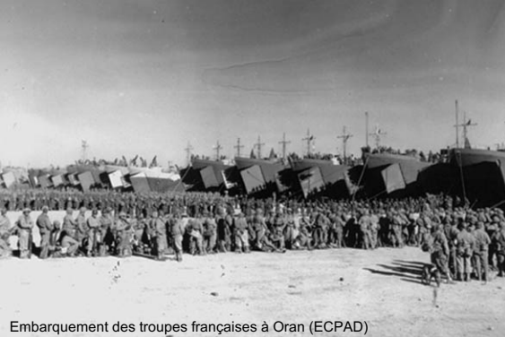
Embarquement des troupes françaises à Oran