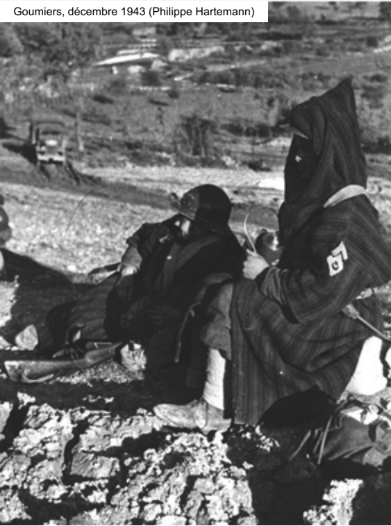
Goumiers, décembre 1943 (Philippe Hartemann)