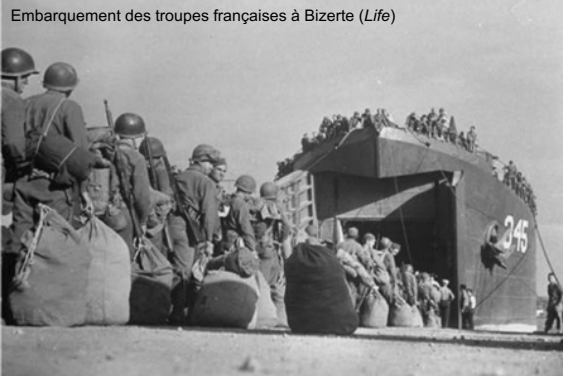
Embarquement des troupes françaises à Bizerte