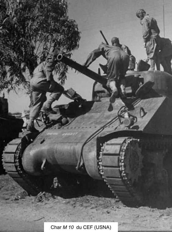
Char M 10 du CEF (USNA)