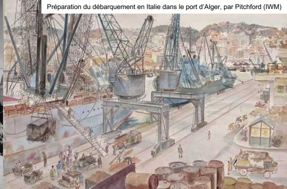
Préparation du débarquement en Italie dans le port d'Alger, par Pitchford (IWM)