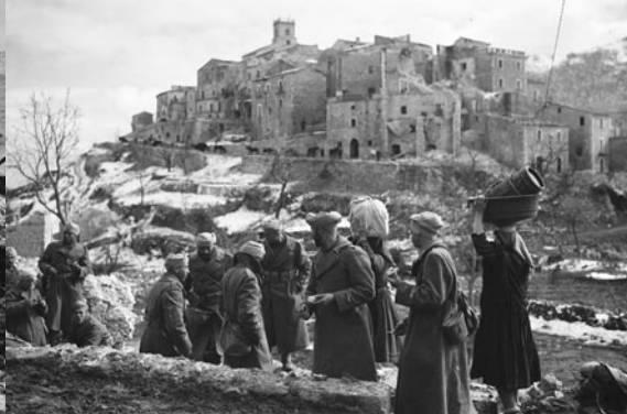
A Viticuso, montée en ligne du 6ème RTM de la 4ème DMM