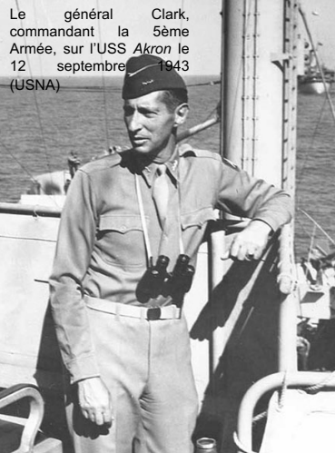
Le général Clark, commandant la 5ème Armée, sur l'USS Akron le 12 septembre 1943