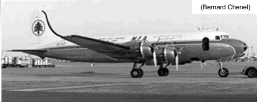
21 décembre 1961 – La Sénia Interception, par les Vautour du Normandie-Niemen , du Douglas DC 4 libanais OD-ADK, transportant 5 tonnes d'armement, contraint de se poser à La Sénia