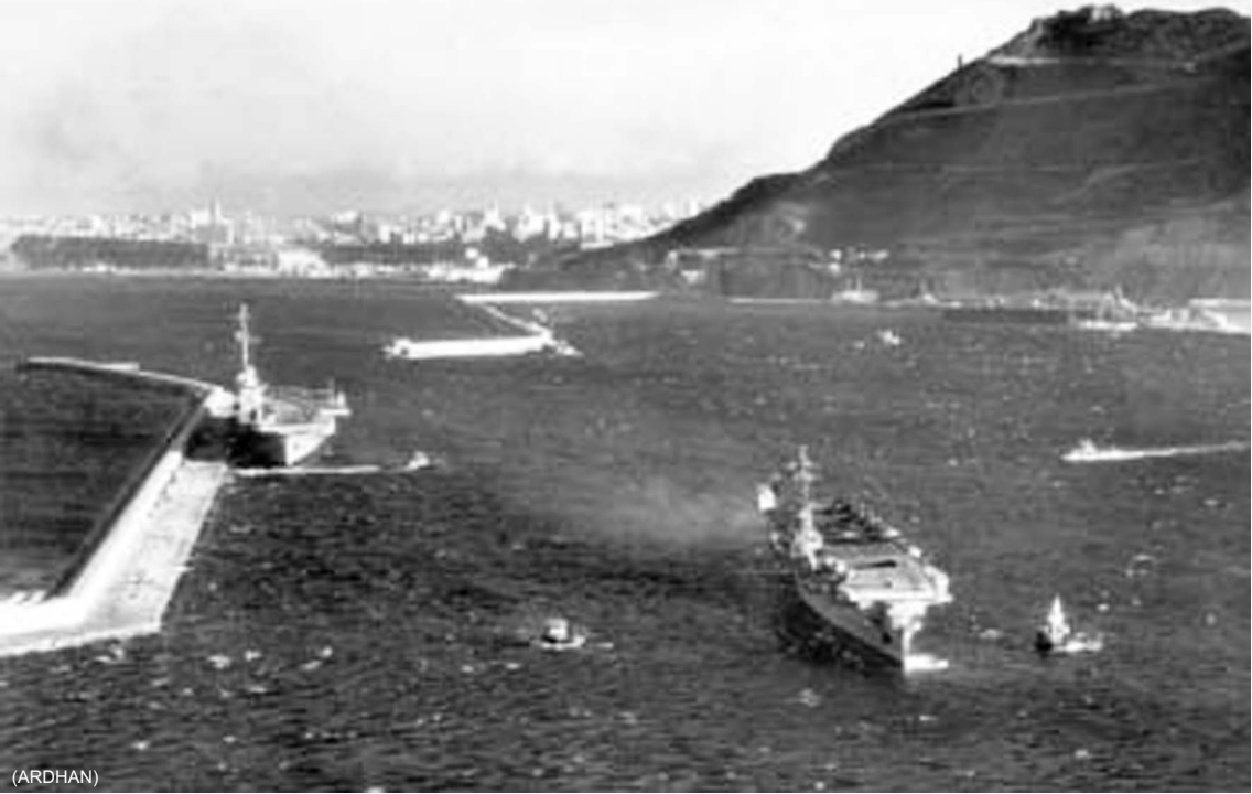
Février 1961 – Mers-el-Kébir – Les portes-avions Clémenceau et Lafayette