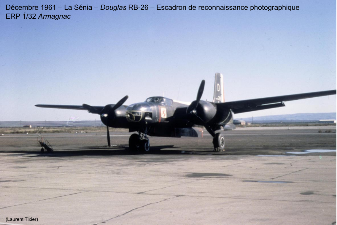
Décembre 1961 – La Sénia – Douglas RB-26 – Escadron de reconnaissance photographique ERP 1/32 Armagnac